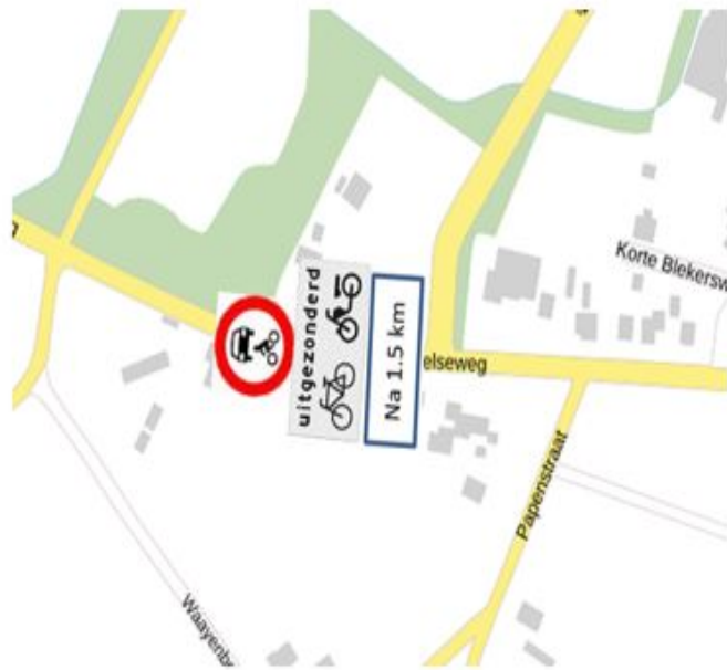
Figuur 3, vooraankondiging Molenweg-Paalbeekweg