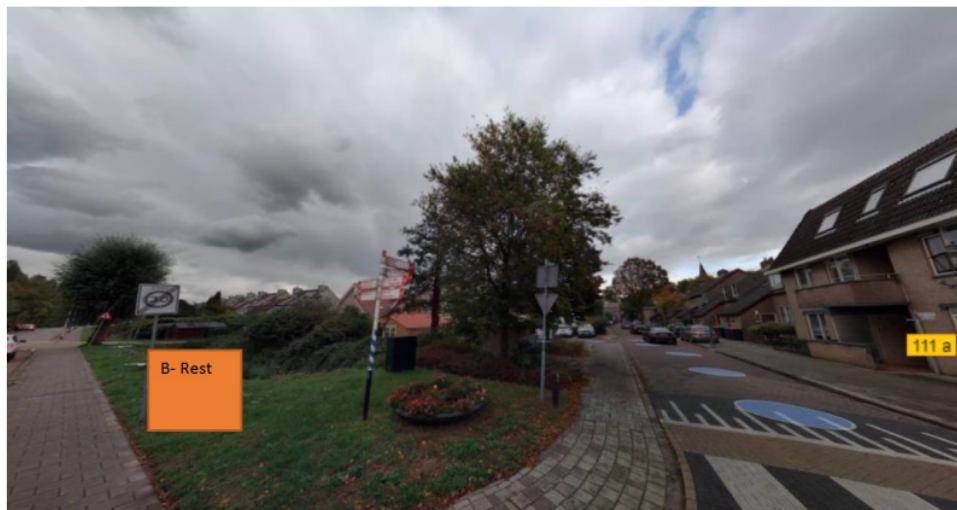
Albrandswaard Locatie CA113a

De betonnen cocon voor PMD+Restafval is hier gewisseld voor een afsluitbare bovengrondse container voor PMD+Restafval