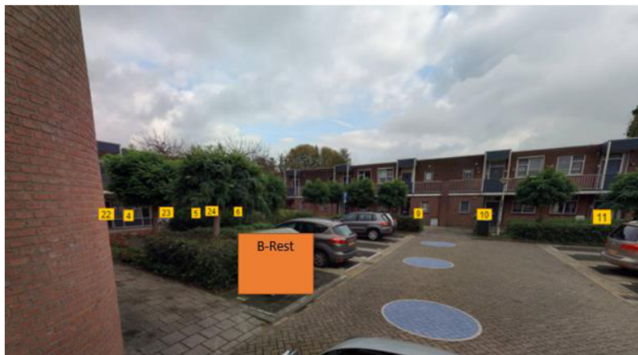
Albrandswaard Locatie SL1