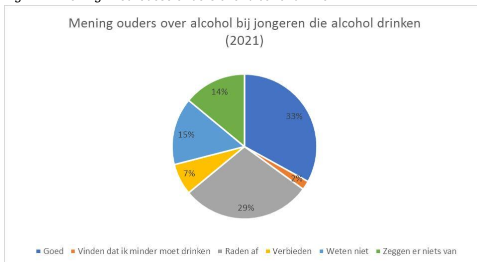
Figuur 2: Mening Enschedese ouders over alcohol drinken

Van alle jongeren heeft 19% geen afspraak met zijn/haar ouders over alcohol. Eén op de drie jongeren heeft een afspraak over de leeftijd dat zij mogen beginnen met drinken. Bij de meeste jongeren is dit vanaf 18 jaar. Opvallend is dat steeds meer jongeren de afspraak hebben vanaf 16 jaar te mogen drinken (20% in 2019 en 30% in 2021). Van de jongeren die alcohol drinken vindt 33% van de ouders het goed dat hun kind alcohol drinkt. Slechts 7% van de ouders verbiedt het (zie figuur 2). Van jongeren die geen alcohol drinken, verbiedt 40% van de ouders het en staat slechts 4% achter het drinken ervan. In totaal over alle jongeren gezien verbiedt 21% van de ouders alcoholgebruik. Dit is een significante afname ten opzichte van 2019 (29%). Ouders staan dus meer alcohol toe dan een paar jaar geleden. Hierbij speelt leeftijd wel een rol. Bij jongeren in klas 2 wordt het drinken van alcohol door 31% van de ouders verboden ten opzichte van 13% in klas 4.