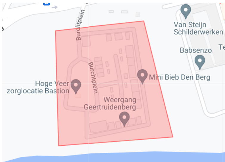
4. Vuurwerkvrije zone Commandeurstraat 16