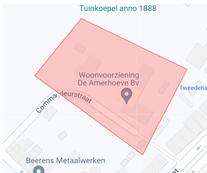
5. Vuurwerkvrije zone Stadsweg 9a01