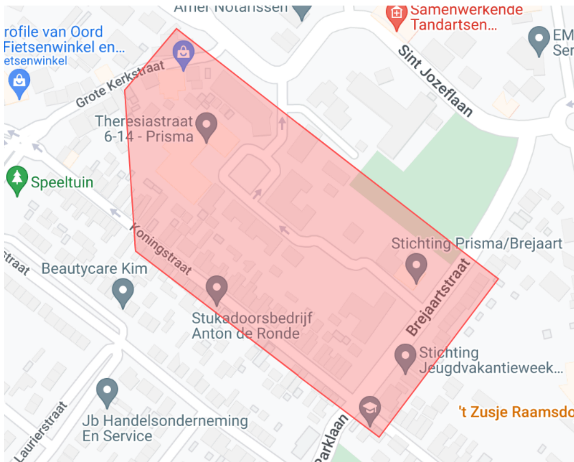
2. Vuurwerkvrrije zone Scheepswerflaan