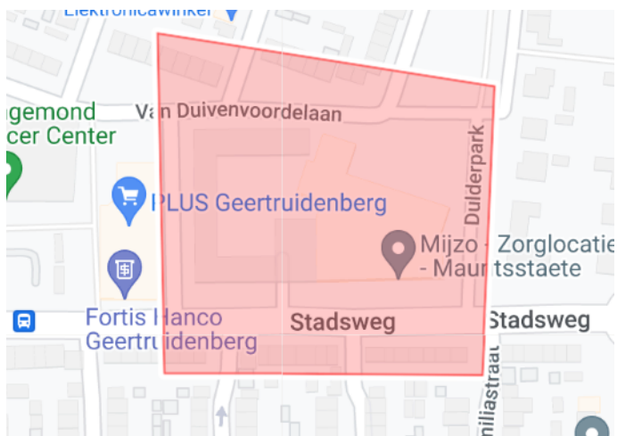
6. Vuurwerkvrije zone St. Agnesstraat 1, Venestraat