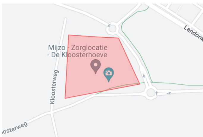
8. Vuurwerkvrrije zone Burggravenlaan 3