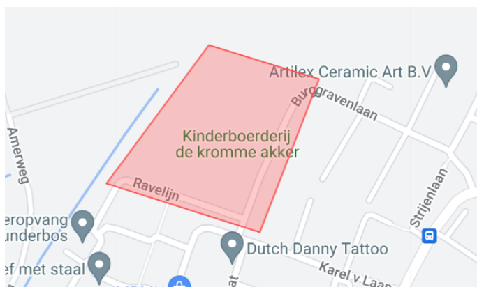
9. Vuurwerkvrrije zone Hertenkamp bij d'Onvermoeide