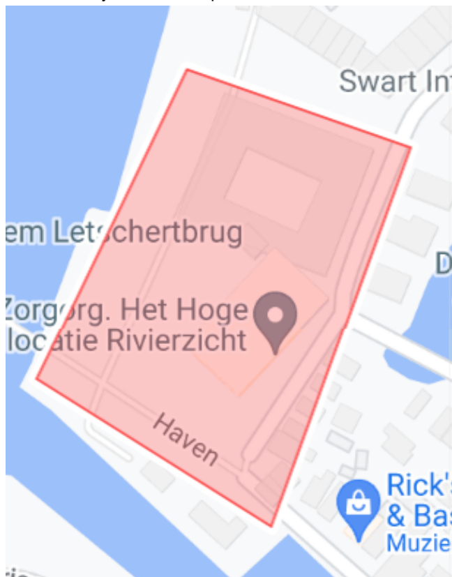
3. Vuurwerkvrrije Zone Burchtplein