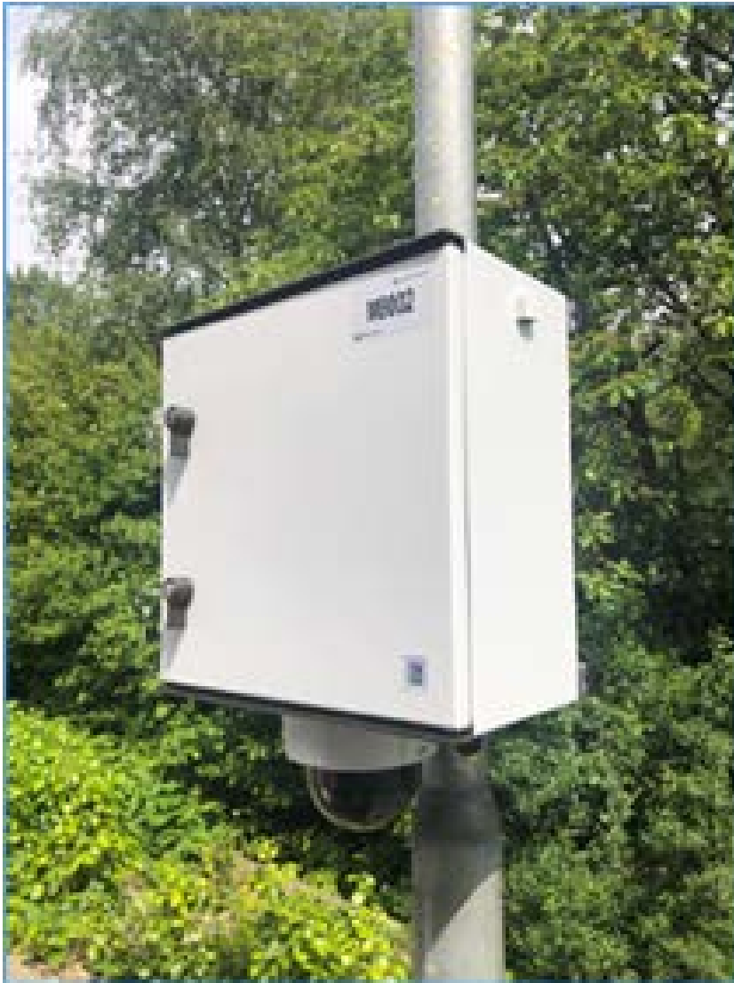
Voorbeelden van type camera's en stroomvoorziening, zoals deze doorgaans voor flexibel cameratoezicht wordt gebruikt.