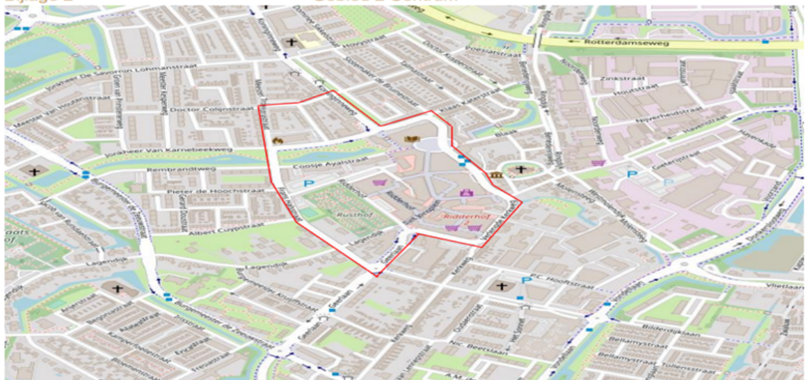
Gebied 2 Centrum