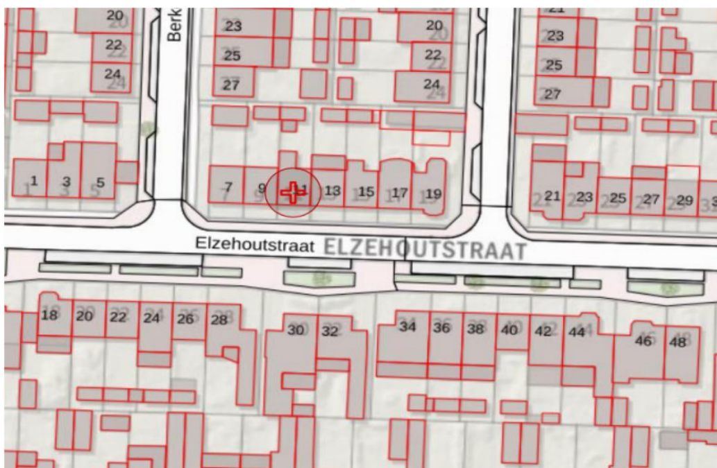
Bijlage bij VKB 2302