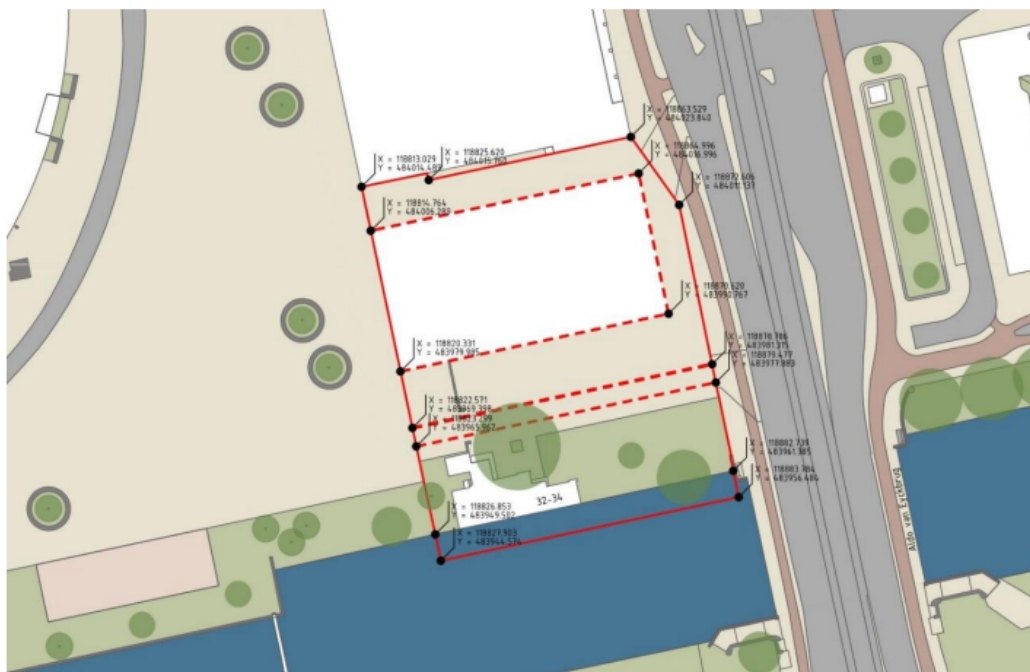
Figuur 2: Coördinatetekening. De doorgetrokken rode lijn geeft de gebiedsgrenzen aan.