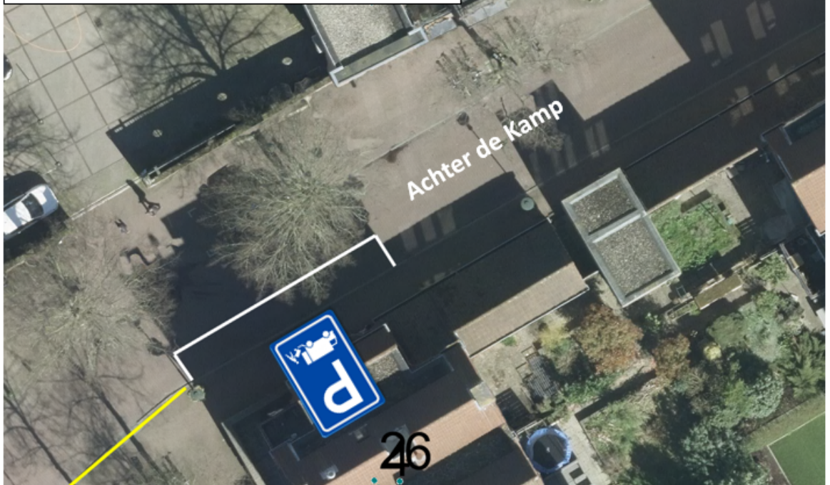
Situatieschets: verkeersmaatregelen Achter de Kamp

Te plaatsen bebording en doorgetrokken gele streep