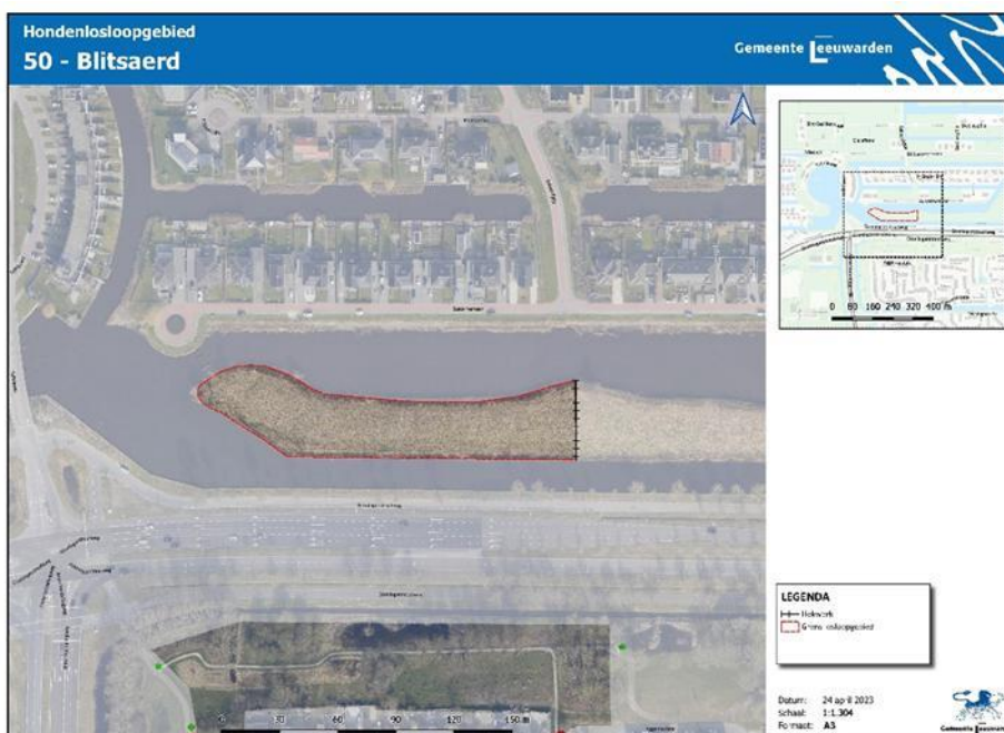
Groene Ster nabij Woelwijk ( correctie begrenzing losloopgebied )

Aldus vastgesteld in de vergadering van 19 september 2023, Nieuwe kaarten hondenlosloopgebieden Blitsaerd