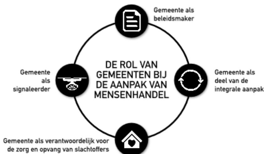
Afbeelding 2: Rol van de gemeente bij de aanpak van mensenhandel volgens de Nationaal Rapporteur.

De staatssecretaris van Justitie en Veiligheid stelt naar aanleiding daarvan dat gemeenten een rol hebben op het gebied van preventie, signalering, handhaving en hulpverlening, en bijdragen aan het opwerpen van barrières tegen mensenhandel 5 . In 2018 werd dan ook in het Interbestuurlijk Programma (IBP) besloten dat elke gemeente in 2022 een duidelijke en geborgde aanpak van mensenhandel moet hebben 6 . Hierna volgde het landelijke programma 'samen tegen mensenhandel' waarin de gemeentelijke rol uitgewerkt werd en een aantal documenten met aanbevelingen zijn opgesteld vanuit Comensha, het CCV en de VNG ter ondersteuning.