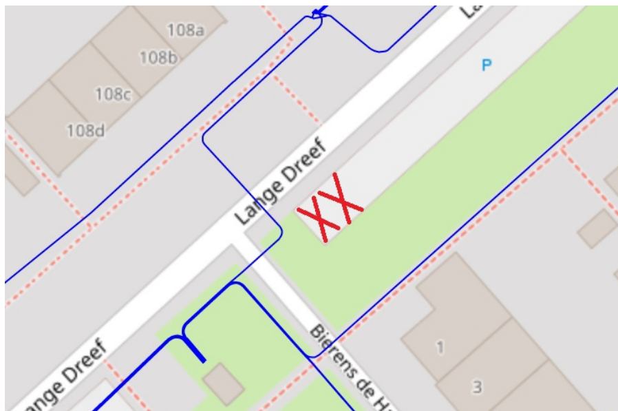
Situatieschets Bierens de Haanerf 1, Driebergen-Rijsenburg