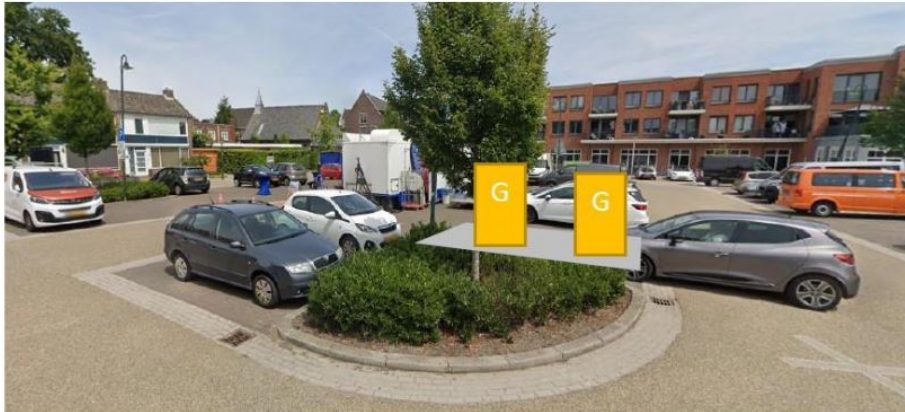
Locatienummer LOC3171AH1: twee ondergrondse verzamelcontainers voor Glas voorzien van een geluiddempende binnenkant