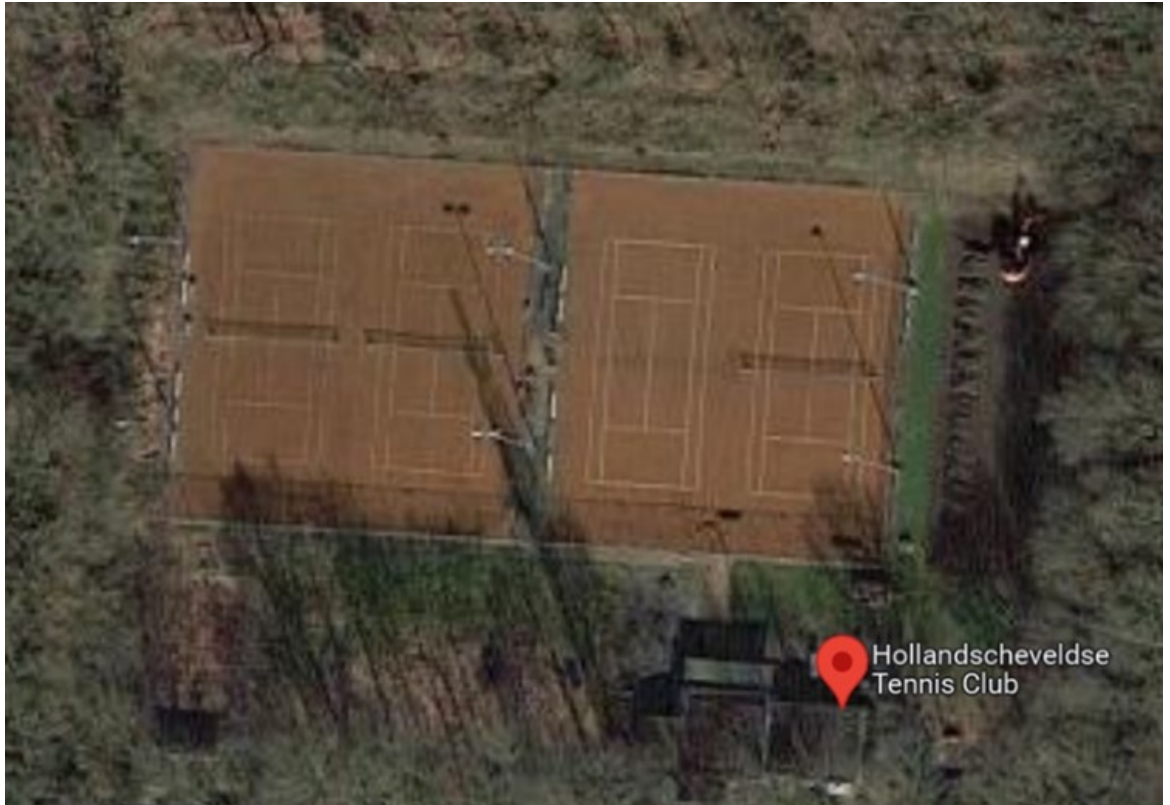
Figuur 4: Tennispark HTC

Achter sporthal de Marke ligt sportpark de Boshhoek. Hier is tennisvereniging HTC gehuisvest. De vereniging pacht de locatie van de gemeente. De vereniging is zelf eigenaar van de kantine en tennisbanen en verzorgt ook zelf het beheer en onderhoud. Op de accommodatie zijn 4 gravel tennisbanen aanwezig en 2 nieuwe (2022) pickleballbanen.