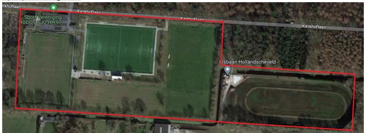
Figuur 5: Sportpark 't Hoge Bos

Op sportpark 't Hoge Bos is sportvereniging HODO gehuisvest. De voetbalvereniging heeft de beschikking over 3 wedstrijdelden voetbal en een trainingsveld. In 2021 is het tweede wedstrijdeld vernieuwd tot een kunstgrasveld. Hierdoor bestaat de trainingscapaciteit feitelijk uit 2 velden. Het 3 e wedstrijdeld is aangewezen als overcapaciteit en wordt door de vereniging zelf in stand gehouden. Op het sportcomplex zijn 6 kleedkamers aanwezig. Tussen de voetbalvelden liggen jeu de boulesbanen van de vereniging 't Diekie.