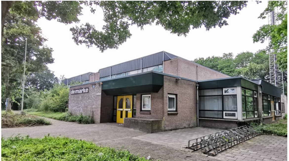
Figuur 3: Sporthal de Marke Hollandscheveld

In Hollandscheveld is één binnensportaccommodatie aanwezig. Dit is sporthal de Marke. De sporthal dateert van 1980 en is in volledig eigendom van de gemeente Hoogeveen. In de sporthal zijn 4 kleedkamers en een kantine aanwezig. De sporthal heeft een sportvloeroppervlakte van netto 22 bij 42 meter. Deze afmetingen voldoen tegenwoordig niet meer aan de standaardeisen van een sporthal en diverse wedstrijdsporten. Voor diverse zaalsporten is de uitloop van het speelveld ten opzichte van de muren te kort. Daarnaast is de sporthal slechts op te delen in twee zaaldelen wat ook beperkingen geeft in de mogelijkheden van diverse (wedstrijd-)sporten. De Marke wordt naast verenigingssport ook door de basisscholen gebruikt voor het bewegingsonderwijs van de Oostenbrink en het Mozaïek, beiden uit Hollandscheveld.