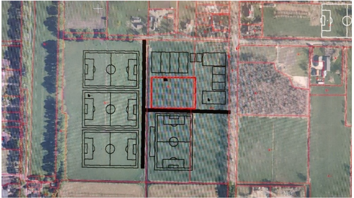
Figuur 9: Clustering Zuideropgaande