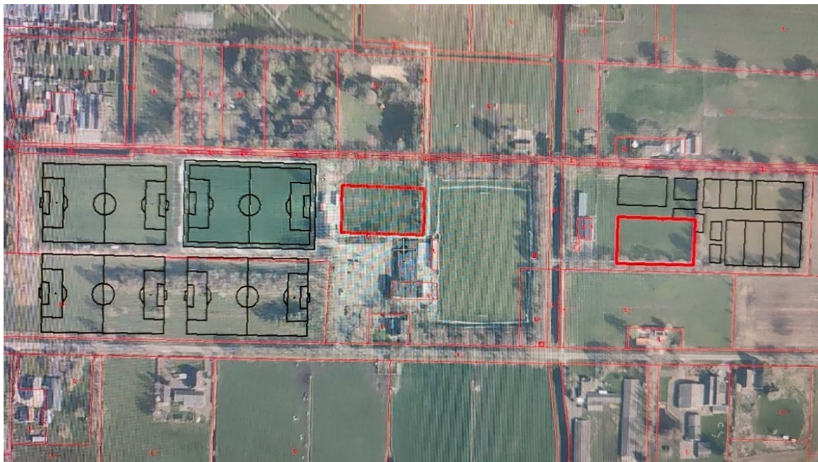
Figuur 10: Clustering de Oosthoek