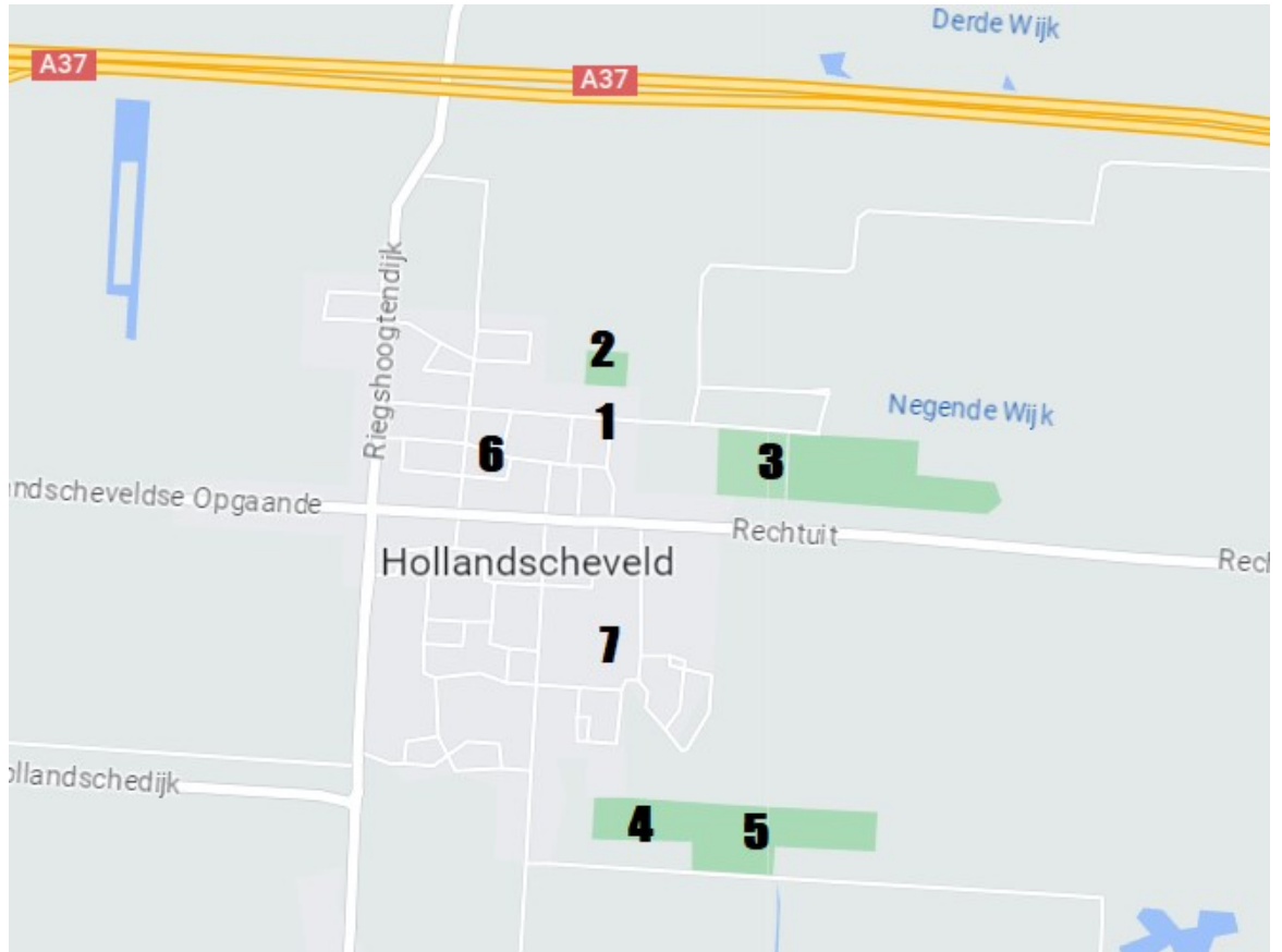
Figuur 1: Overzichtskartaart sportaccommodaties en scholen Hollandscheveld

Op de overzichtskartaart van figuur 1 zijn de volgende sportlocaties (en twee onderwijslocaties) in Hollandscheveld aangegeven: