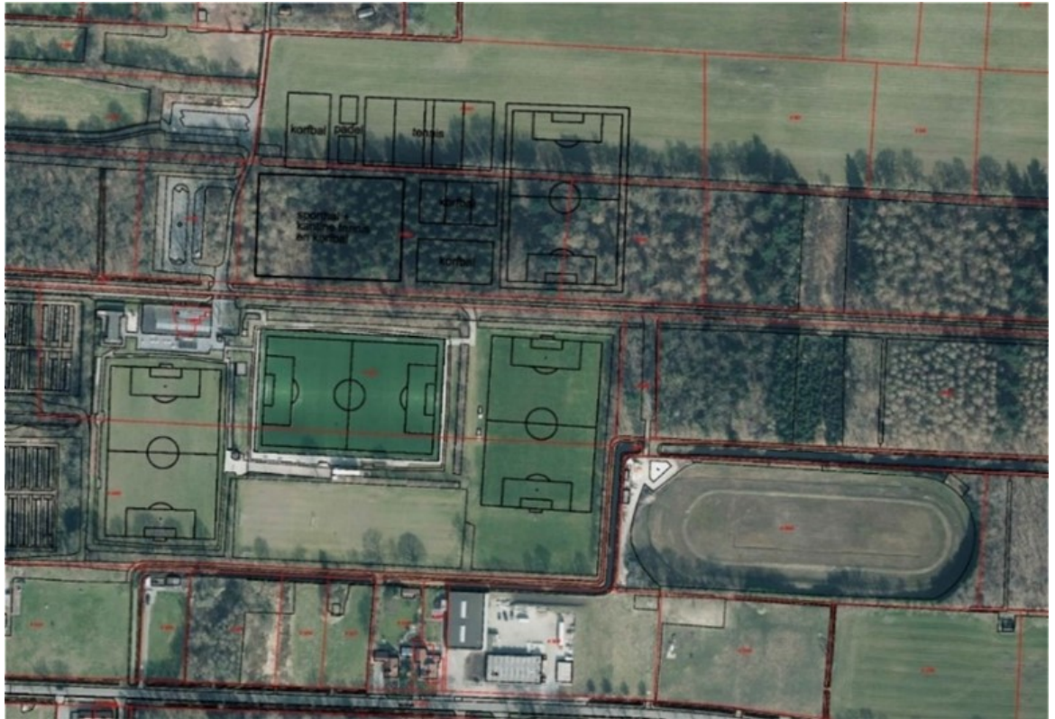
Figuur 8: Clustering sportpark 't Hoge Bos