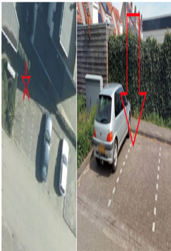
Prinses Marijkestraat 10