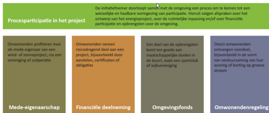
Figuur 2. Participatiewaaier

De Nederlandse Vereniging van Duurzame Energie heeft samen met een aantal andere deelnemers aan de elektriciteitstafel van het Klimaatakkoord een overzicht gemaakt van de participatiemogelijkheden, de zogenaamde participatiewaaier (zie figuur 2). Met de participatiewaaier wordt inhoud gegeven aan lokaal eigendom.