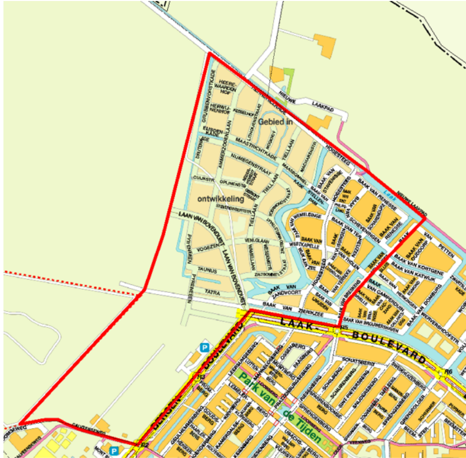
WKO_Interferentiegebied Laakse Tuinen, Velden 1F en Waterdorp