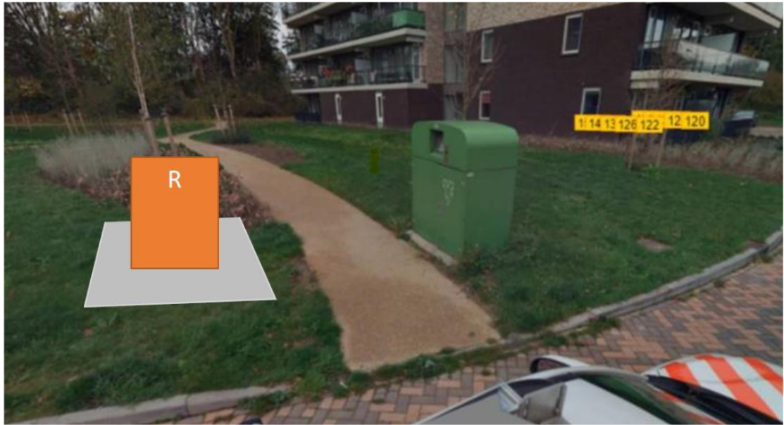
Locatienummer LOC2991RS64 : een ondergrondse verzamelcontainer voor PMD+restafval