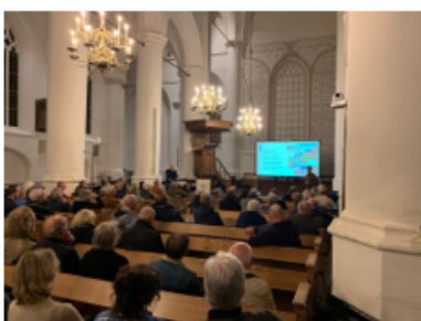
Foto: Informatiemoment parallelweg Voorwijk Foto: Informatiemoment Zandweg