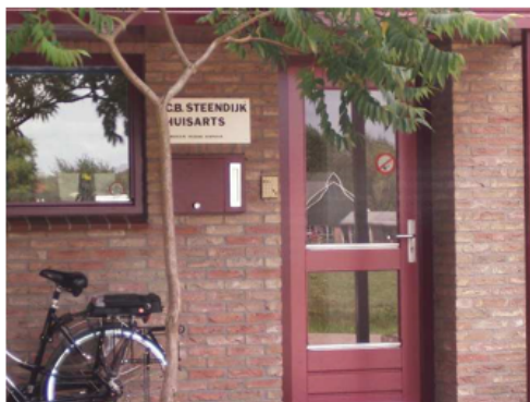
Reclame bij aan huis gebonden beroep