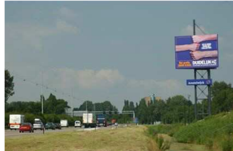
Grote reclamezuil (niet toegestaan)