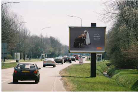
Billboard (niet toegestaan)