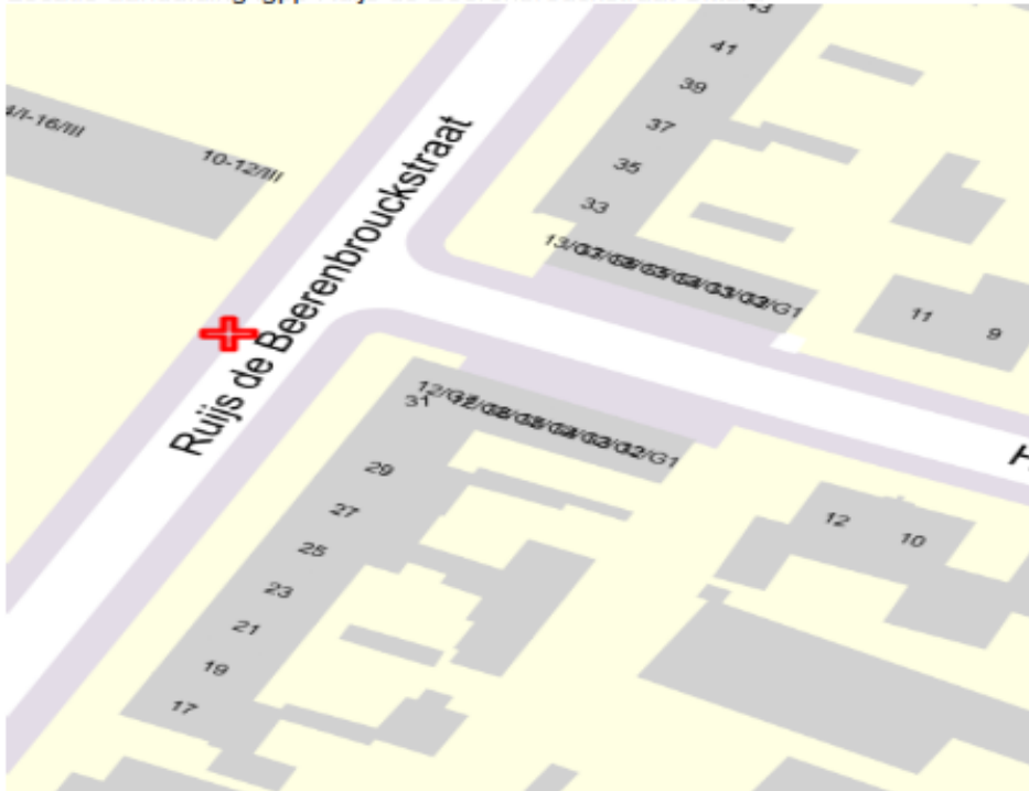
Locatie-aanduiding igpp Ruijs de Beerenbrouckstraat Sittard