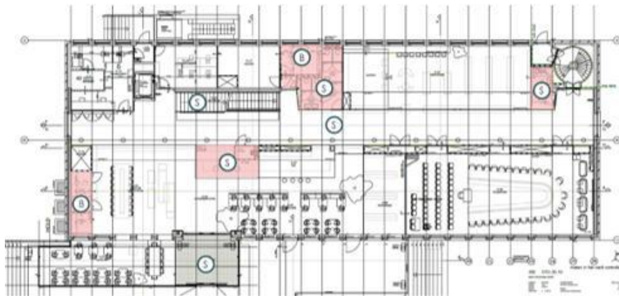
Plattegrond begane grond