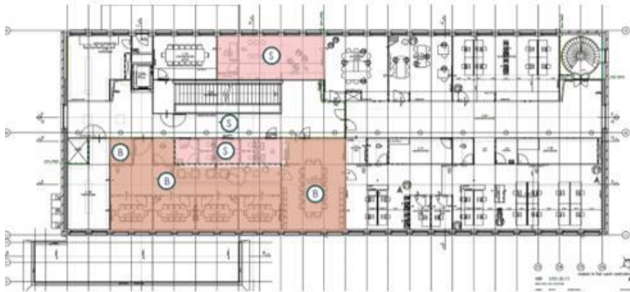
Plattegrond eerste verdieping