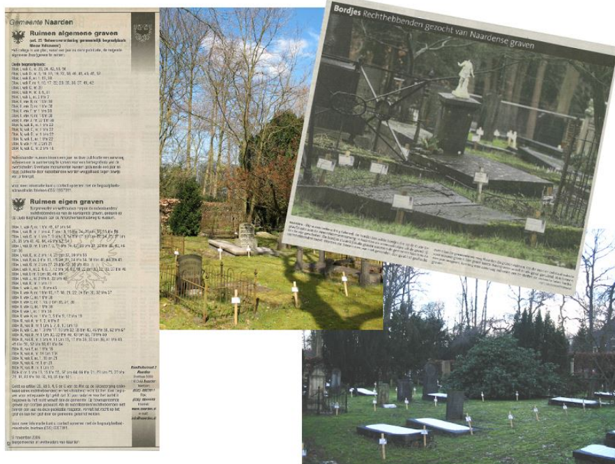
Onderzoek naar rechthebbenden