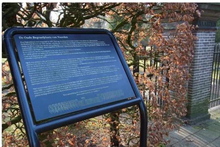
Infobord nabij de ingang van de Oude Begraafplaats

Foto verwijderd ivm AVG Open Monumentendag