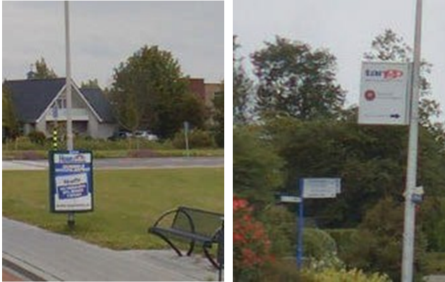
Bestaande sandwichpanelen en lichtmastreclame in Zuidplas