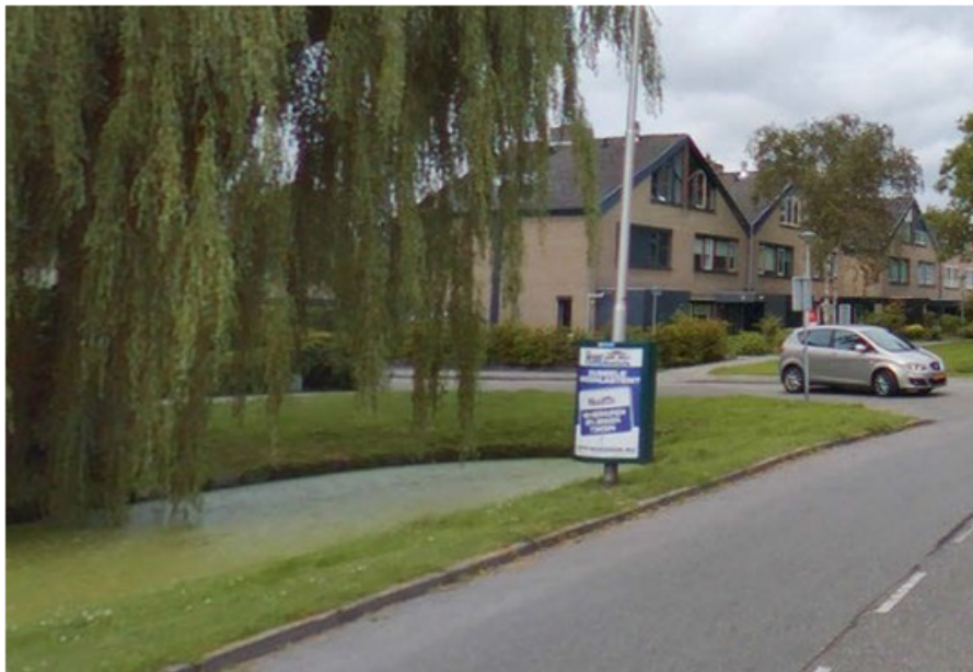
Sandwichpaneel aan de Schielandsingel in Zevenhuizen

Ten behoeve en ter waarborging van de vrijheid van meningsuiting zal de gemeente een aantal vrije plakplaatsen dienen te realiseren. Deze plakplaatsen zijn uitdrukkelijk niet bestemd voor commerciële buitenreclame of verkiezingsaffiches.