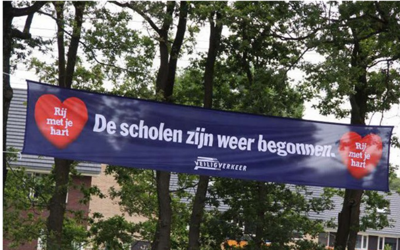
Voorbeeld van een spandoek