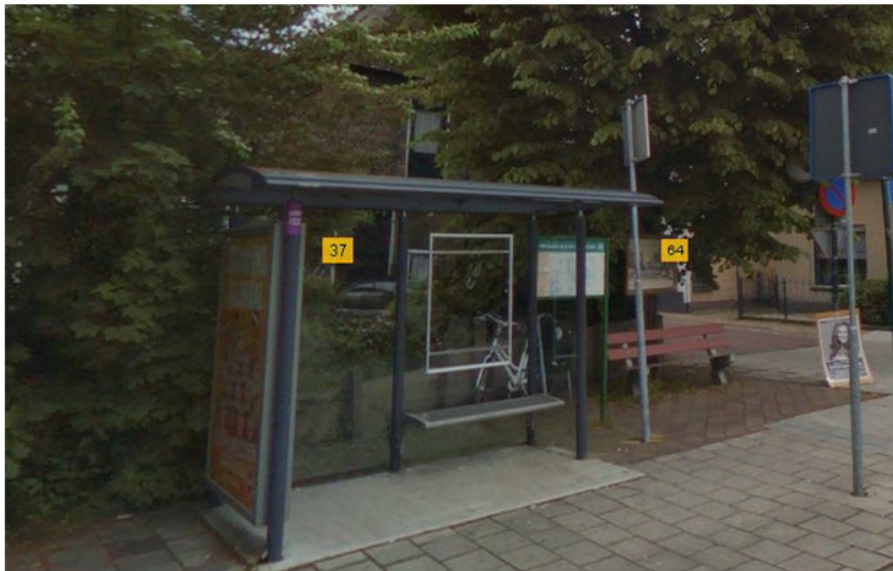
Bestaande abri's in Zuidplas