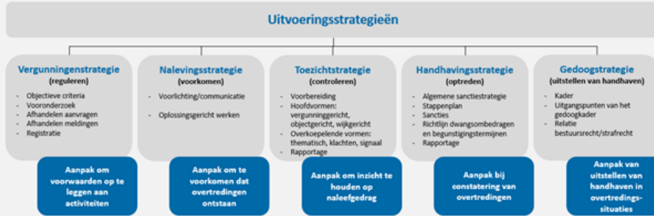
Afbeelding 2: De strategieën

In de figuur hieronder is de samenhang tussen de strategieën weergegeven. In de bijlagenbundel van dit VTH-beleid zijn de strategieën nader uitgewerkt.