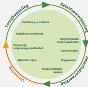
Afbeelding 2: Beleidscyclus onder de Omgevingswet

De OFGV die namens de gemeente verschillende taken uitvoert op het gebied van milieu werkt ook aan haar Big-8 cyclus. Dit naar aanleiding van kritische feedback van het interbestuurlijk toezicht. Wij volgen deze ontwikkeling met belangstelling en mogelijk stellen we voor om hierop aan te sluiten.