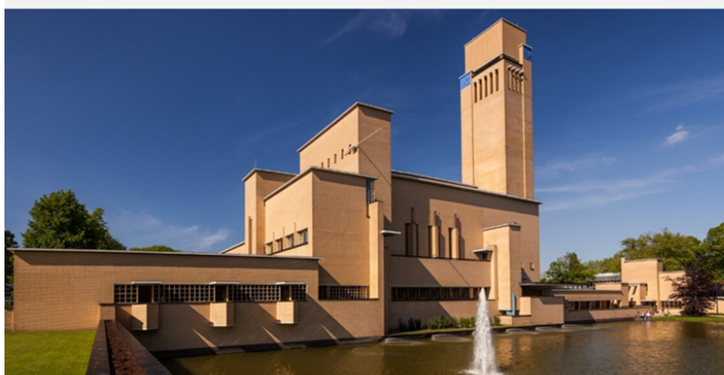
Hilversum, december 2021 Actualisatie juni 2023