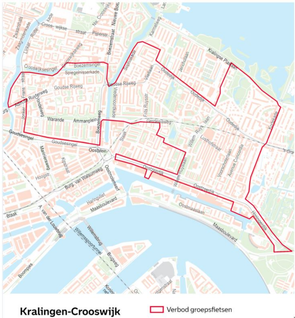
Kaart 2: Gebied Centrum