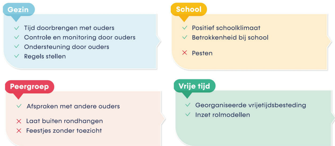
Figuur 2: Beschermende en risicofactoren in de vier omgevingen

Opgroeien in een Kansrijke Omgeving (OKO) is een Nederlandse aanpak, gebaseerd op het IJslandse preventiemodel. Met de OKO-aanpak werkt iedereen in een gemeente (lokaal) aan het vormen van een positieve leefomgeving voor jongeren. OKO richt zich op jongeren van 12 tot 18 jaar. In Figuur 2 staan de vier omgevingen met de wetenschappelijk onderbouwde beschermende en risicofactoren.