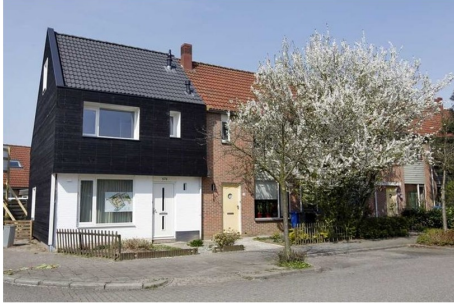
Niet wenselijk: opvallende inpassing met groot hoogteverschil en afwijkende dakgoot.