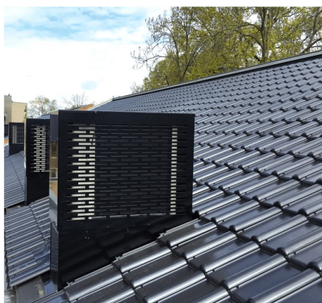
Wenselijk: buitenunits als onderdeel van de architectuur.

De installaties zijn gericht op verduurzaming en hebben vaak een vermindering van ruimtelijke kwaliteit tot gevolg. Daarom worden ze meegenomen in de criteria voor beoordeling. Bij nieuwbouw is uitgangspunt dat units in de architectuur van het hoofdgebouw worden meegenomen tenzij deze benodigd zijn op afstand van het gebouw, zoals bij oplaadpalen.