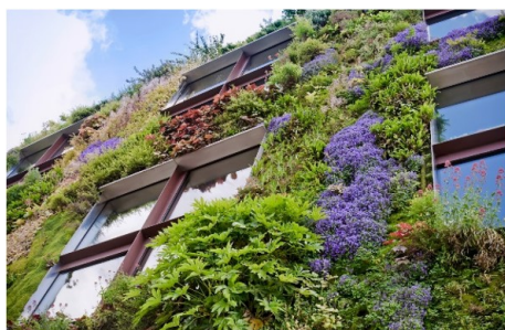
Wenselijk: bloei in een groene gevel accentueert de seizoenen.