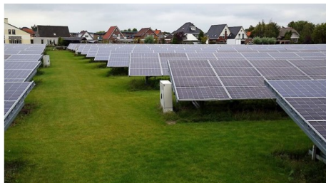
Niet wenselijk: grootschalig zonnepark als belangrijkste landgebruik.