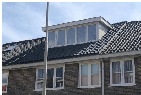
Wenselijk: zorgvuldige inpassing met minimale hoogte- en kleurverschillen.

Isolatie aan de binnenzijde van een dak heeft doorgaans geen effect op de ruimtelijke kwaliteit. Bij buitenisolatie van daken wordt op het dak een laag isolatiemateriaal aangebracht waardoor de dakbedekking, doorgaans dakpannen, hoger komt te liggen. Ook platte daken kunnen worden voorzien van buitenisolatie waardoor ook daar het dak hoger wordt. Hierdoor ontstaat invloed op de ruimtelijke kwaliteit. Bij een zon-thermisch dak lopen leidingen met water door de dakbedekking heen welke worden opgewarmd door de zon of gekoeld door de buitenlucht. Hiermee kan een woning verwarmd en gekoeld worden. Doorgaans zorgen deze ook voor verhoging van het dak en moeten dan worden meegenomen in deze criteria.