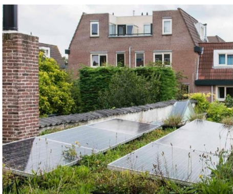
Wenselijk: optimale combinatie van energie opwekken en koeling van panelen door een groen dak.