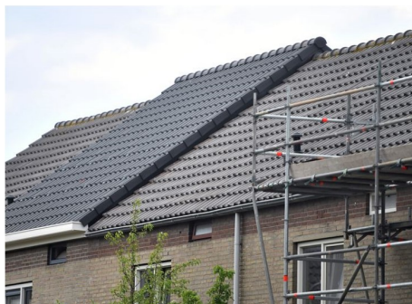
Niet wenselijk: opvallende inpassing met groot hoogteverschil en afwijkende dakgoot.