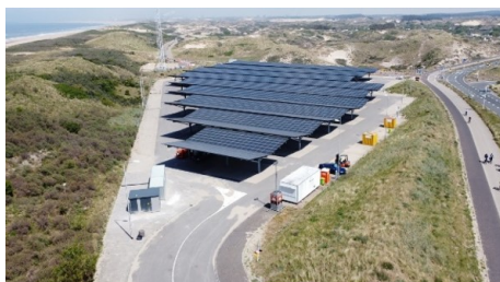
Wenselijk: zonnepark zonder hinder op andere functies zoals parkeren.

Binnen de bestemmingen 'Agrarisch met waarden – Landschappelijke openheid' en 'Agrarisch met waarden – Natuur' is het college bevoegd eisen te stellen ten behoeve van behoud, herstel en/of ontwikkeling van natuurlijke, archeologische, landschappelijke en/of cultuurhistorische waarden.