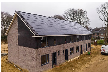
Wenselijk: geen verstoring, een rustige uitstraling en bijpassende kleuren.

De panelen op daken zijn vaak op het zuiden gericht en zijn daarom niet altijd uit het zicht te houden. Daarom dienen panelen in het zicht zorgvuldig te worden ingepast. Wanneer geen panelen geplaatst kunnen worden kan gezocht worden naar een collectieve oplossing elders. Bij nieuwbouw is uitgangspunt dat panelen in de architectuur van gebouwen worden meegenomen. Ook is uitgangspunt dat bij bruikbaarheid van panelen niet ten koste mag gaan van grote inheemse, gebiedseigen boomsoorten.