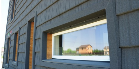
Gevelisolatie kan het uiterlijk van een woning sterk veranderen. Afhankelijk van de plek waar de woning staat kan dit wel of niet wenselijk zijn.