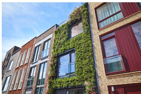
Wenselijk: zorgvuldige inpassing en behoud stedenbouwkundig karakter.

Doorgaans hebben de gevels een verfraaiend effect op de ruimtelijke kwaliteit, mits zorgvuldig aangebracht. De groene gevels zorgen voor een nadrukkelijke verandering van het uiterlijk van een gebouw.