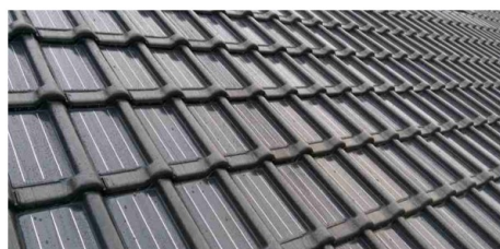
Nieuwe oplossingen op basis van maatwerk met de adviescommissie afstemmen.