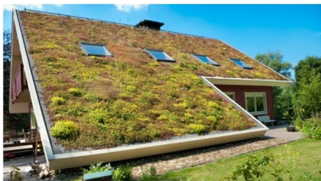
Wenselijk: een groen dak als verrijking voor de ruimtelijke kwaliteit

dat bij nieuwbouw rekening wordt gehouden met biodiversiteit door begroeiing met gebiedseigen beplanting toe te passen.