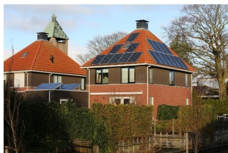
Niet wenselijk: plaatsing met verspringen, contrasterende kleuren en opvallende randen.