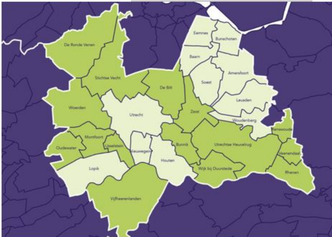
Figuur 4: Overzicht van het werkgebied van de omgevingsdiensten Groen is het werkgebied van de ODRU; lichtgroen is het werkgebied van de RUD.

De U&H-strategie betreft het werkgebied van de twee omgevingsdiensten (zie afbeelding hieronder). Het betreft de gemeenten Amersfoort, Baarn, Bunnik, Bunschoten, De Bilt, De Ronde Venen, Eemnes, Houten, Leusden, Lopik, Montfoort, Nieuwegein, Oudewater, Renswoude, Rhenen, Soest, Stichtse Vecht, Utrecht, Utrechtse Heuvelrug, Veenendaal, Vijfheerenlanden, Wijk bij Duurstede, Woerden, Woudenberg, IJsselstein, Zeist en de provincie Utrecht.