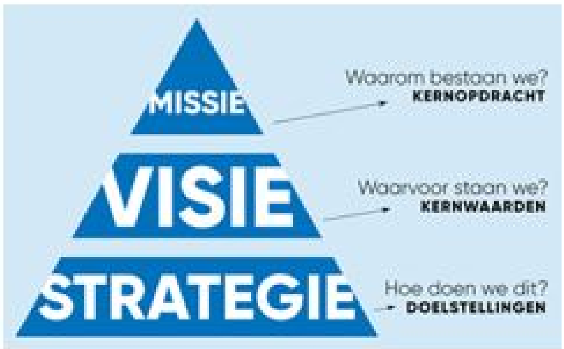
Figuur 3: Verhouding 'missie-visie-strategie'

Het uitgangspunt voor deze U&H-strategie is dat de missie het fundament onder de organisatie is. De visie beschrijft de manier waarop handen en voeten aan deze missie kan worden geven.