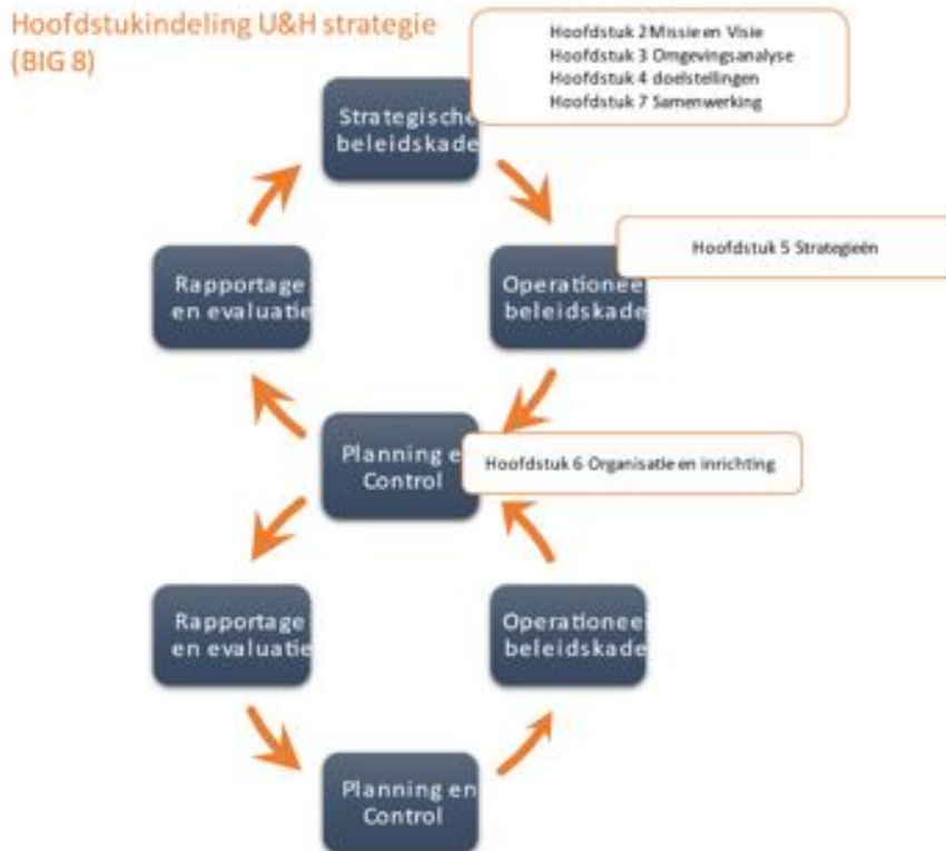
Figuur 8: hoofdstukindeling van BIG-8 cyclus

In paragraaf 1.3 staat de BIG 8 cyclus beschreven. De strategieën zorgen voor een vertaling van het strategisch beleidskader naar het operationeel beleidskader.