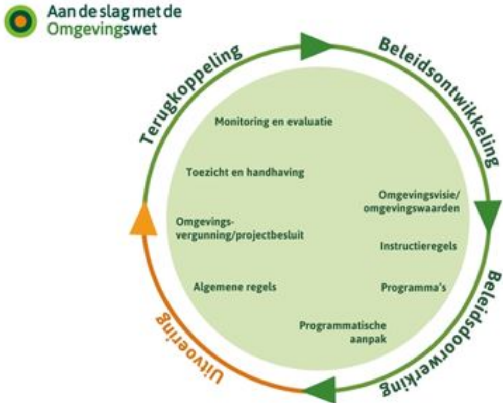
Figuur 2: Plan-do-check-act beleidscyclus Omgevingswet

De plan-do-check-act beleidscyclus is veel meer omvattender. VTH-taken zijn in die cyclus te definiëren als één van de mogelijk in te zetten instrumenten.