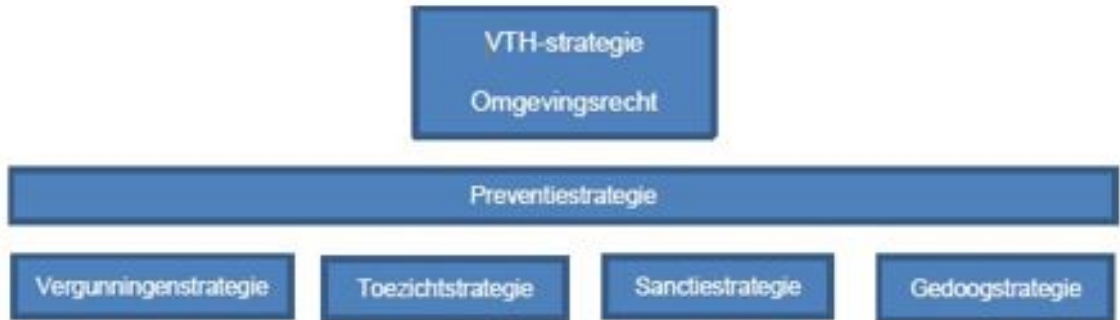
Figuur 7: onderlinge verhouding VTH-strategieën

In paragraaf 1.3 staat de BIG 8 cyclus beschreven. De strategieën zorgen voor een vertaling van het strategisch beleidskader naar het operationeel beleidskader.