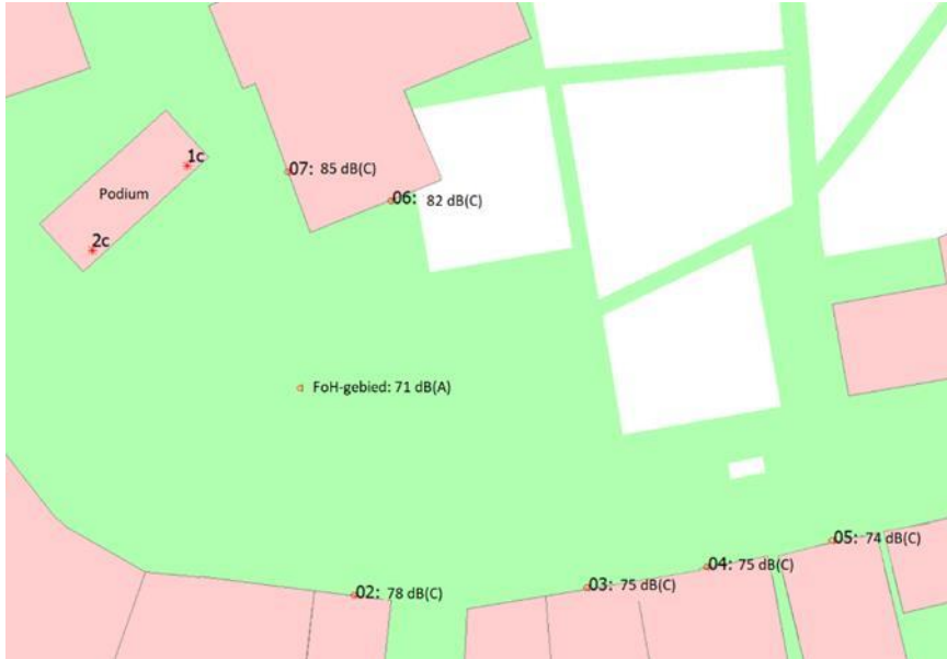
Ijsbaan Den Burg