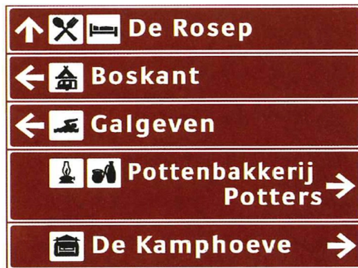
Voorbeeld van een strokenbord