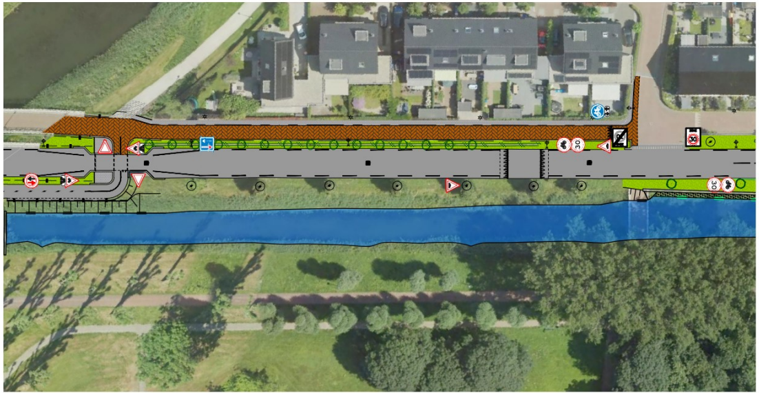
Stroomzijde (deel 3/4)