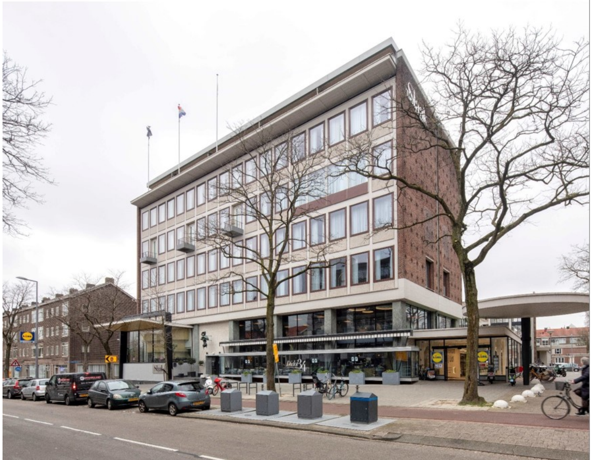
Het Slaakhuis, het voormalige kantoor van dagblad Het Vrije Volk (rijksmonument)

Ook is de afgelopen jaren goed samengewerkt met Stichting Stadsherstel historisch Rotterdam die zich inzet voor het behoud en exploitatie van monumenten en historisch waardevolle gebouwen. Organisaties als de stichting Open Monumentendag, Platform Wederopbouw en Stadsherstel zijn belangrijke ambassadeurs van het Rotterdams erfgoed.