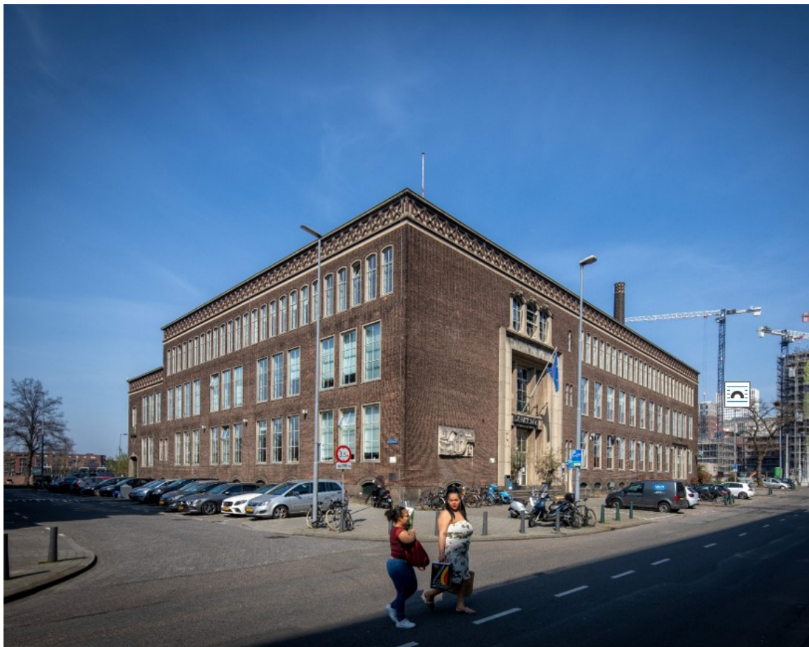
De voormalige Hogere Zeevaartschool aan de Willem Buytewechstraat, beter bekend als De Machinist (gemeentelijk monument) | E. Fecken