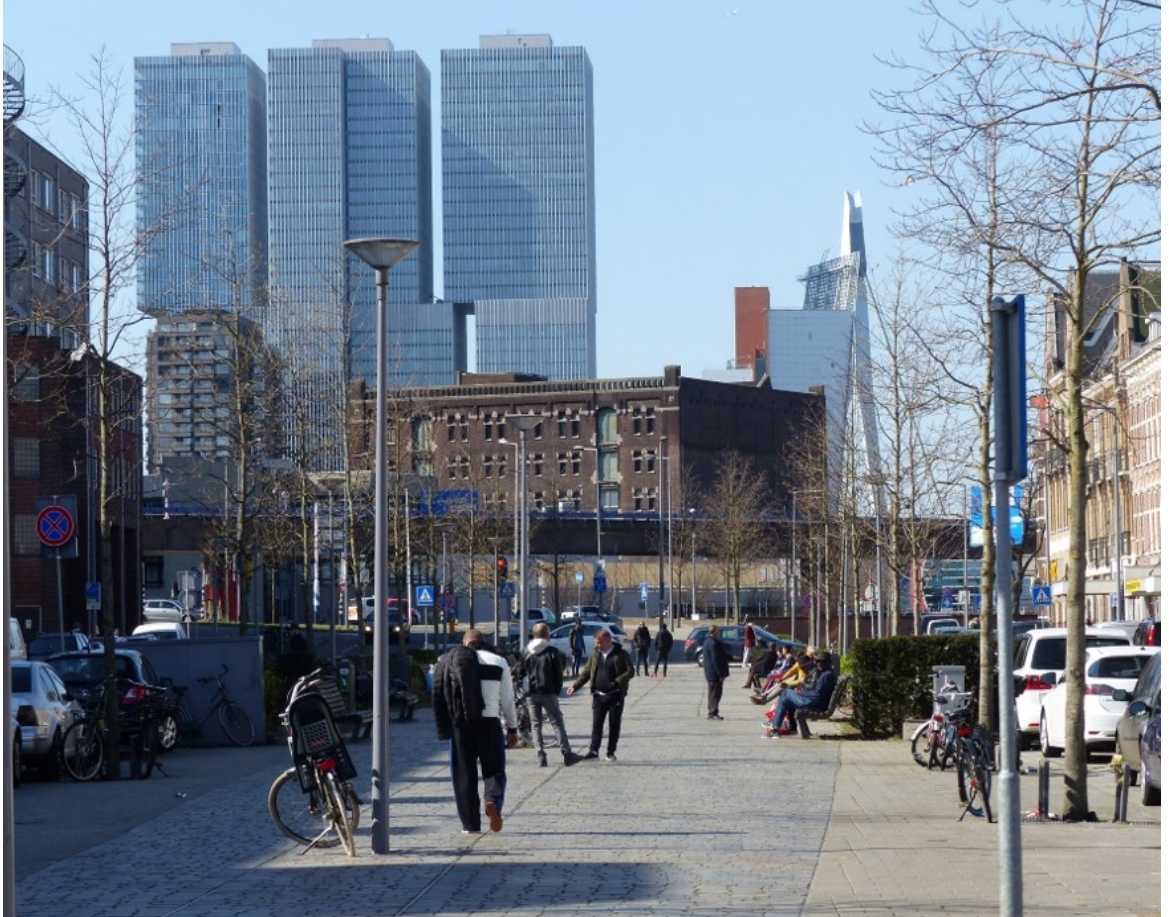
Tijdlagen: De Afrikaanderwijk met 19 de eeuwse bebouwing – rijksmonument Pakhuis Santos – recente bebouwing op de Wilhelminapier | H. Grootenhuijs

langrijke opgave om het erfgoed van Rotterdam representatiever te maken voor alle burgers van de stad en de geschiedenis zo ook completer te presenteren. Met de komst van de Omgevingswet ligt er in de toekomst meer nadruk op de betrokkenheid van burgers, op toegankelijkheid, inclusiviteit en diversiteit. Erfgoed raakt, net als architectuur, iedere Rotterdammer en is daarom ook een actueel en continu onderwerp van gesprek. De komende jaren zal er met de Erfgoedagenda nog meer worden ingezet op het verbindende aspect van erfgoed.