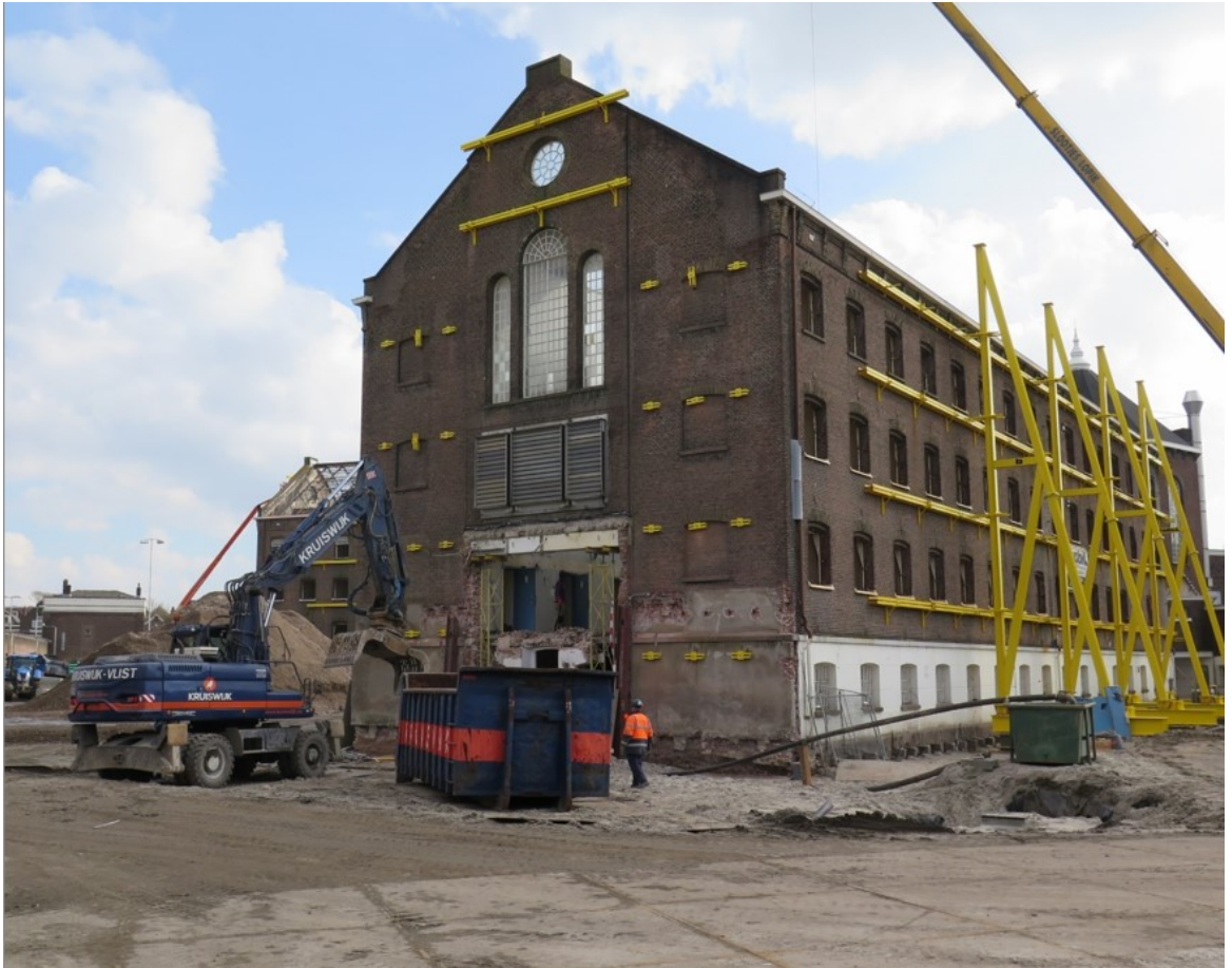
De transformatie van het Huis van Bewaring aan de Noordsingel tot appartementencomplex. Project opgeleverd najaar 2021 | R. Stoute

2023-2027: De vergunningverlening voor beschermde monumenten behoort tot de wettelijke taken en is de rode draad voor het werkproces van de monumenteninspecteurs van de afdeling Bouw- en Woningtoezicht. De verwachting is dat het aantal vergunningprocedures voor beschermde monumenten in de looptijd van de Erfgoedagenda zal toenemen als gevolg van de toenemende verdichting, de groei van het aantal karakteristieke en beschermde objecten in de stad en het toenemende aantal initiatieven met betrekking tot het stedelijk erfgoed. Daarbij speelt ook de invoering van de Omgevingswet een rol.