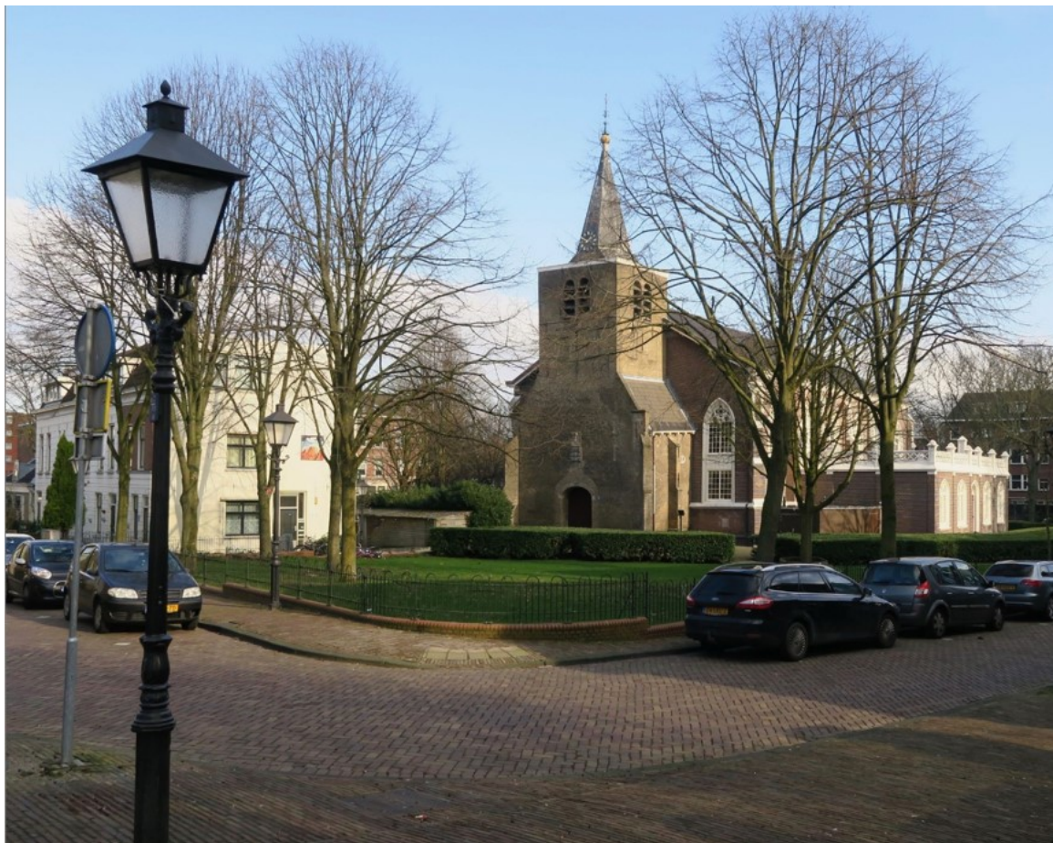
De Oude kerk in Oud-Charlois (rijksmonument) | R. Stoute