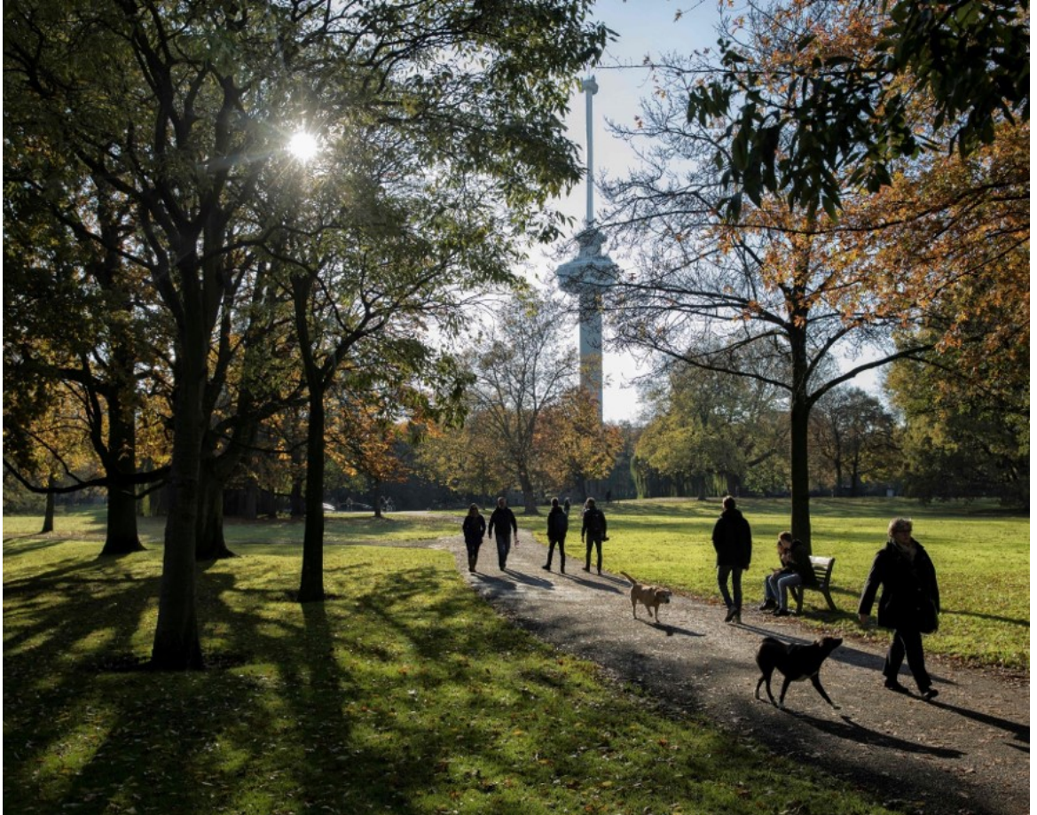
Het Park en de Euromast (beide rijksmonument) | E. Fecken

Ook een Bouwhistorisch Onderzoek kan voor beschermde monumenten verplicht worden gesteld via de Erfgoedverordening Rotterdam. Een Bouwhistorisch Onderzoek moet voldoen aan de Richtlijnen zoals die zijn opgesteld door de Rijksdienst van het Cultureel Erfgoed.