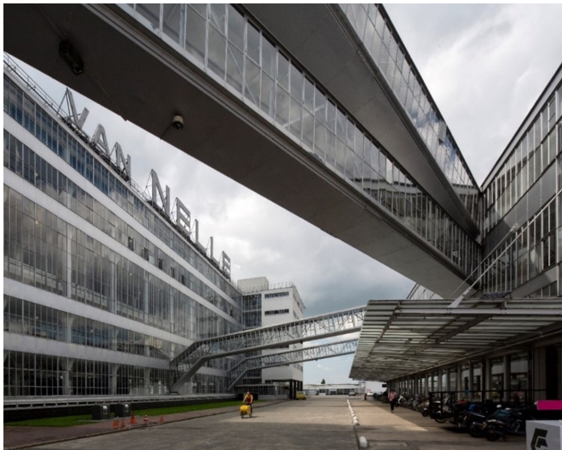
UNESCO Werelderfgoed Van Nellefabriek (UNESCO Werelderfgoed)

2023-2027: De Van Nellefabriek en de gemeente Rotterdam werken als sitholders met het rijk aan de voortgangsrapportage voor UNESCO. Ook wordt er vanuit de kernwaarden van het Werelderfgoed een studie uitgevoerd naar de ontwikkelmogelijkheden binnen de bufferzone. Er vindt driemaandelijks overleg plaats tussen eigenaar, gemeente en de Rijksdienst voor het Cultureel Erfgoed.