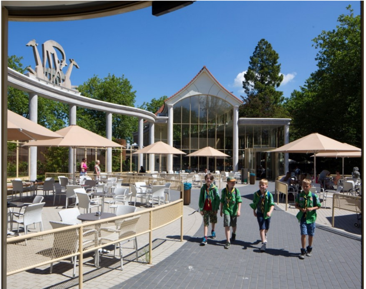
Gerestaureerd giraffenverblijf in het rijksmonument Diergaarde Blijdorp | E. Fecken