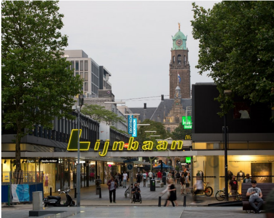
Zichtlijn vanaf de Korte Lijnbaan, onderdeel van het complex Lijnbaan (rijksmonument), op het Stadhuis (rijksmonument) | E. Fecken