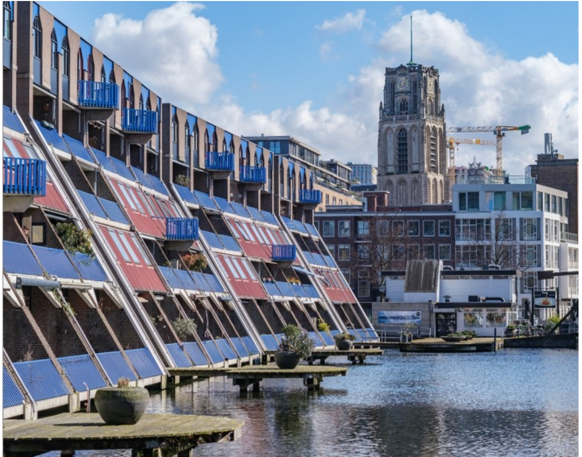
Tijdlagen aan het Haagseveer met op de voorgrond bebouwing uit de jaren 80, daarachter de wederopgebouwde binnenstad met de gedeeltelijk herbouwde Laurenskerk uit de 15 de eeuw (rijksmonument) | Gemeente Rotterdam