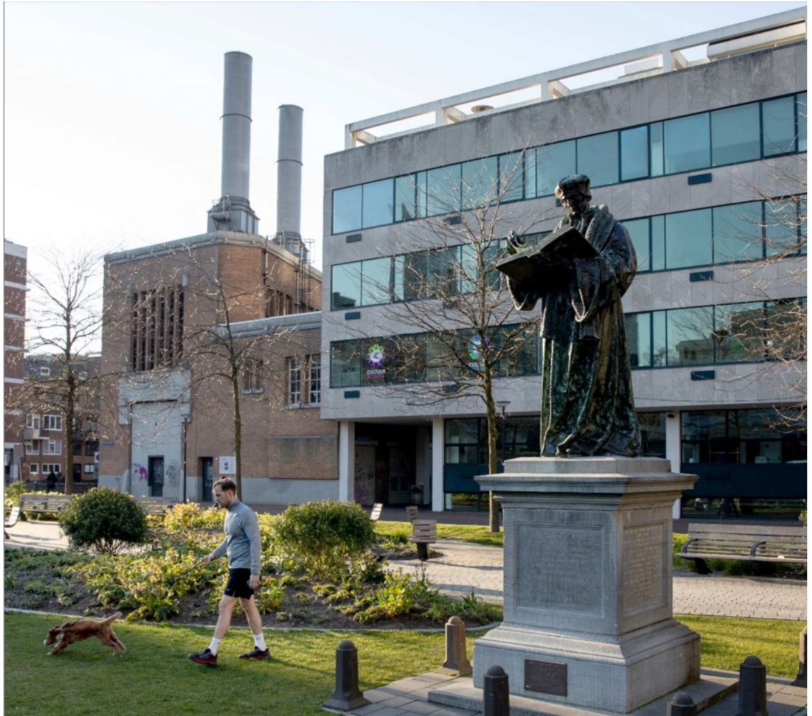
Het standbeeld van Erasmus (rijksmonument) op het Grotekerkplein voor de Laurenskerk met op de achtergrond het gemeentelijk monument De Heuvel | Eric Fecken