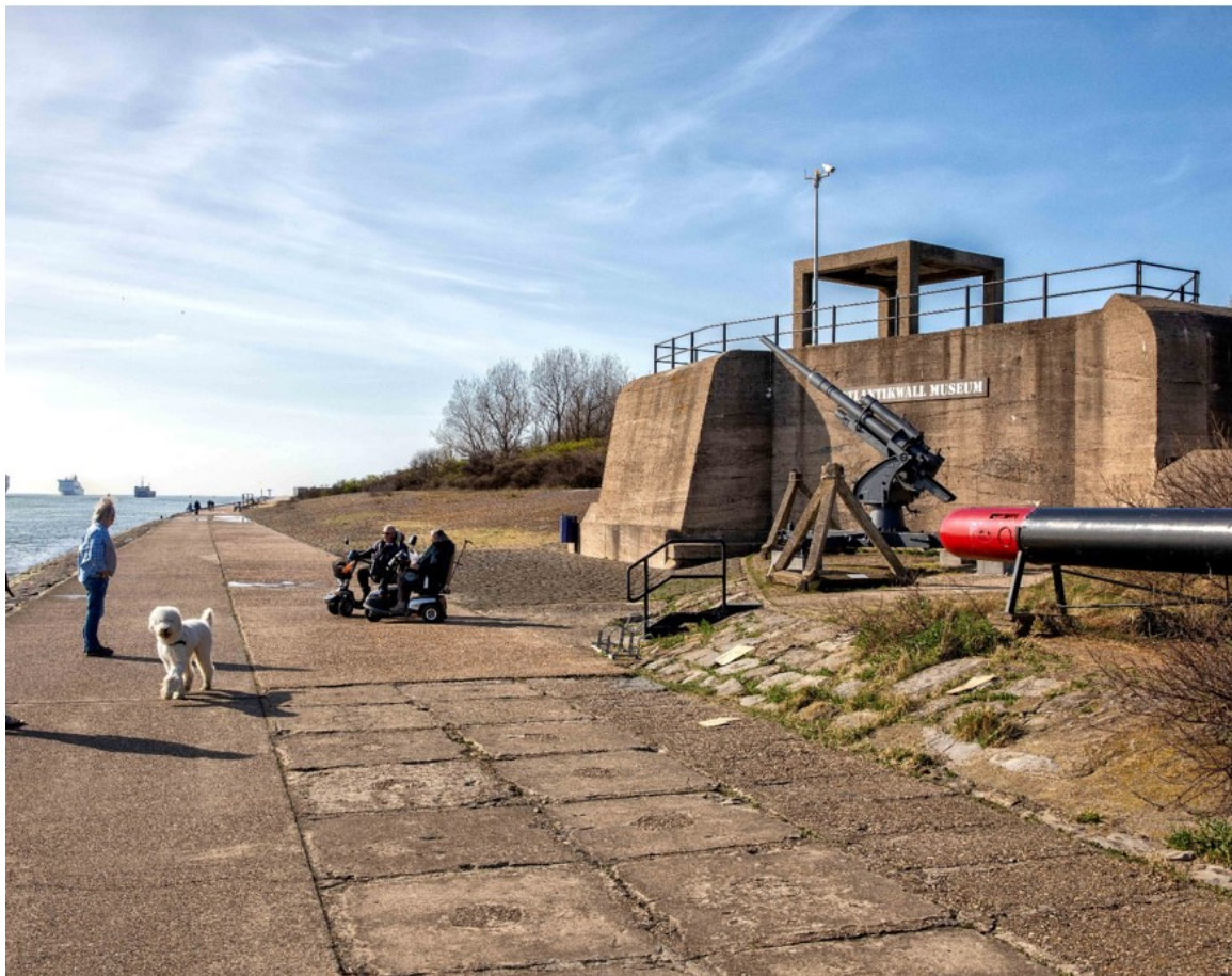
De voormalige stelling Nordmole gelegen in het Voorduin te Hoek van Holland (gemeentelijk monument) | E. Fecken