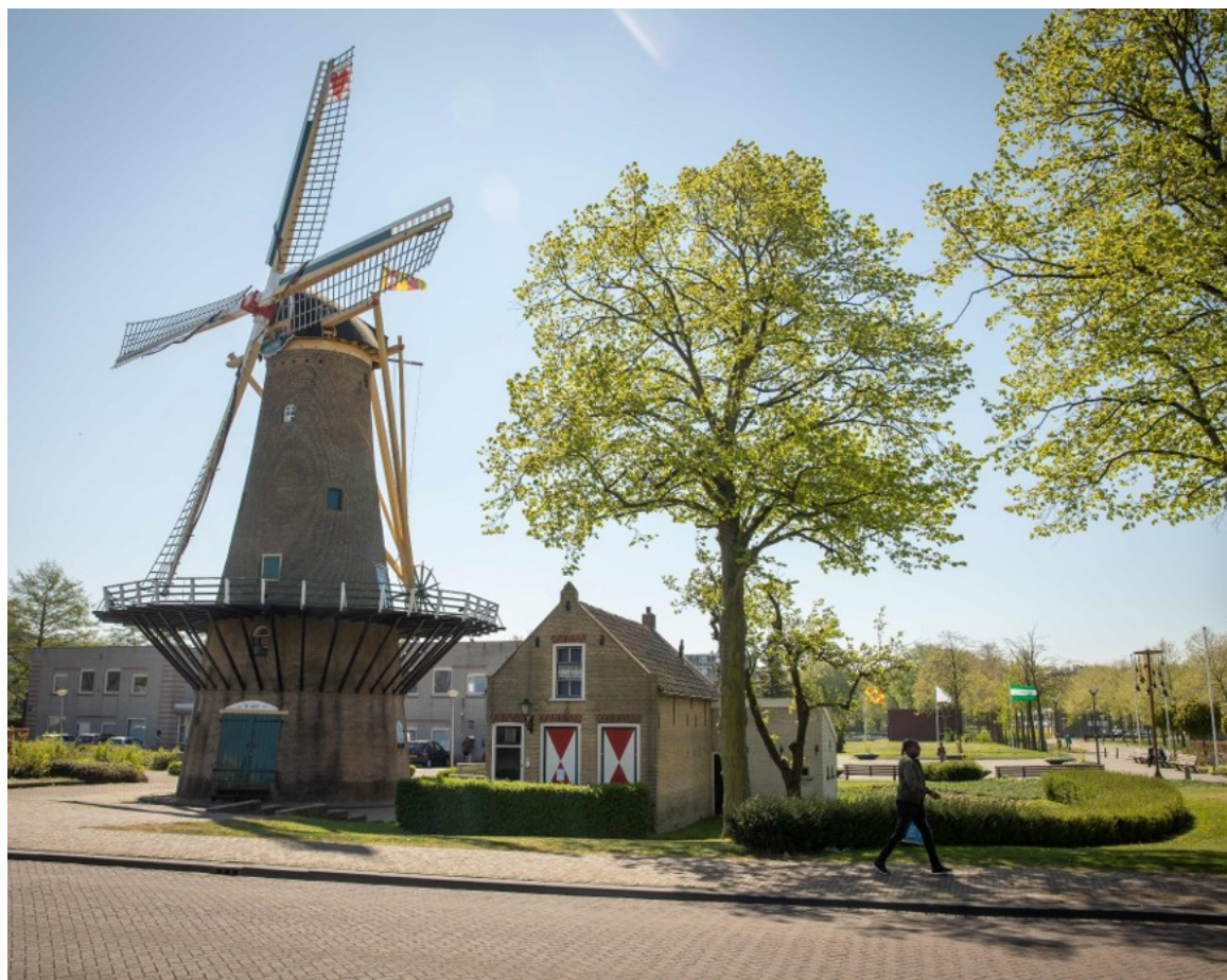
Korenmolen en molenaarswoning De Hoop in Rozenburg (rijksmonument) | E. Fecken

In het in maart 2019 uitgebrachte sectoradvies Monumenten en Archeologie van de nationale Raad voor Cultuur is over Rotterdam een korte beschouwing opgenomen die ingaat op het belang van herbestemming in onze stad. Onder verwijzing naar een artikel op het digitale platform Voer wordt gesteld: “Dat kennis en waarden hand in hand gaan, bewijst de aanwijzing van naoorlogse monumenten in Rotterdam. Toen in 2007 de Top 100 wederopbouw 1940 – 1959 werd voorgedragen voor bescherming, stonden er op de lijst maar liefst 20 monumenten uit Rotterdam. De meeste Rotterdammers deed het destijds weinig, maar sindsdien is er wat veranderd in de havenstad die een haat-liefdeverhouding heeft met haar eigen geschiedenis. ‘Rotterdam is een stad, achtervolgd door haar verleden, nostalgisch naar de toekomst en niet in staat om in het heden te leven’, schreef Crimson Architectural Historians in 2009 nog. Het draagvlak om de historie te respecteren, doorstond in november 2013 de vuurproef toen de gemeenteraad een motie aannam van de ChristenUnie-SGP voor meer ‘historisch besef’. Hoewel de sloopkogelangst bleef, is Rotterdam tegelijk koploper in herbestemming en transformatie geworden. De wederopbouwmonumenten uit de Top 100 zijn inmiddels omarmd en zijn richtinggevend bij herontwikkeling geworden.”