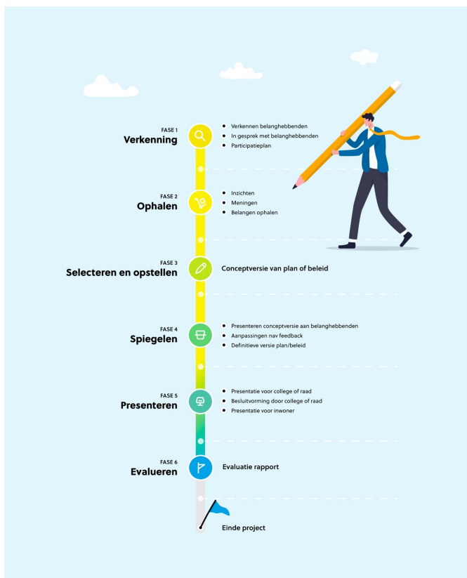
Figuur 1. Fasen van het participatietraject..