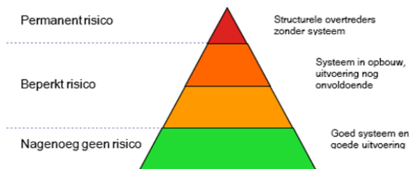
Figuur 2: Risico-pyramide

Per hotspot wordt de kans op overtredingen in kaart gebracht. Die kans wordt bepaald op basis van kenmerken zoals deurbelid, het gebruik van leeftijdscontrolesystemen, openingstijden, doelgroep en naleving. Figuur 2 laat zien hoe de verschillende typen verkopers kunnen worden ingedeeld.