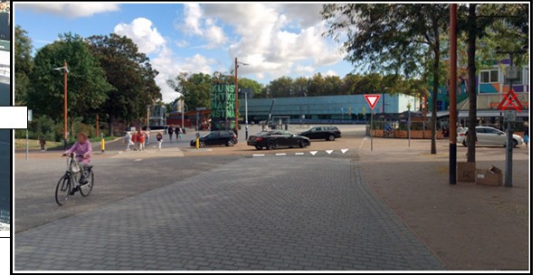
Ridderstraat-Voerweg, Burchtstraat-Voerweg; voorrang tekening 24-04-2023