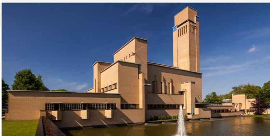
Hilversum, december 2021