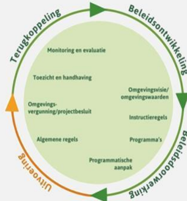
Afbeelding 2: Beleidsdoodskring onder de Omgevingswet

De OFGV die namens de gemeente verschillende taken uitvoert op het gebied van milieu werkt ook aan haar Big-8 cyclus. Dit naar aanleiding van kritische feedback van het interbestuurlijk toezicht. Wij volgen deze ontwikkeling met belangstelling en mogelijk stellen we voor om hierop aan te sluiten.