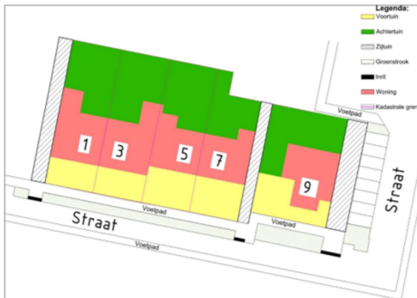
Figuur 1: afbeelding ter verduidelijking definities voortuin, zijtuin en achtertuin.