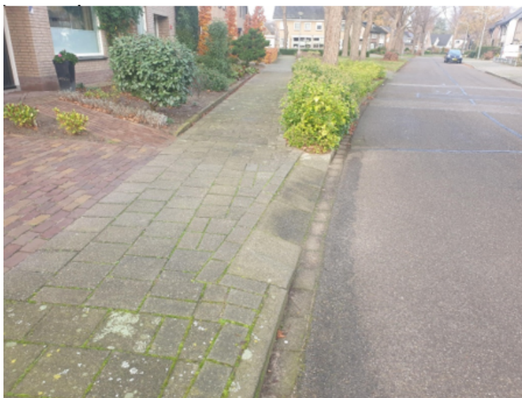
Figuur 4: voorbeeld van een niet-openbare uitweg

In figuur 4 is een voorbeeld van een niet-openbare uitweg weergegeven (CROW- publicatie).