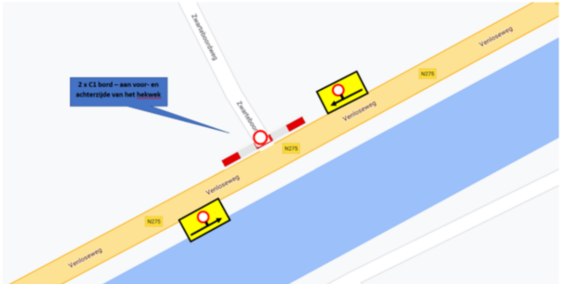
Het volle gas weekend - overzichtstekening