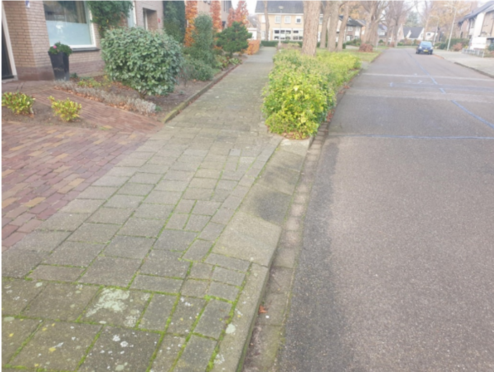
Figuur 4: voorbeeld van een niet-openbare uitweg

In figuur 4 is een voorbeeld van een niet-openbare uitweg weergegeven (CROW- publicatie).