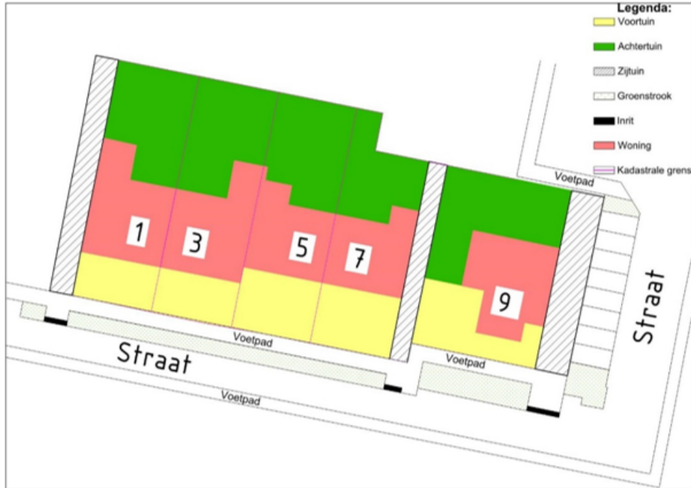
Figuur 1: afbeelding ter verduidelijking definities voortuin, zijtuin en achtertuin.