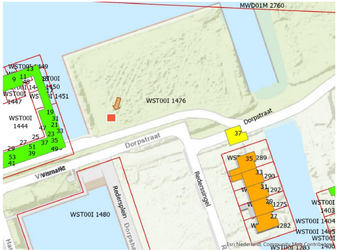
BIJLAGE III: locatie Jacob Catshof Winschoten