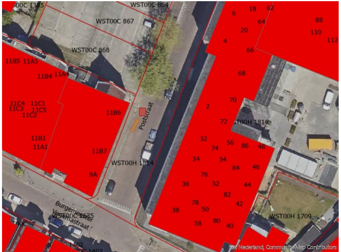
BIJLAGE II: locatie Dorpstraat Blauwestad