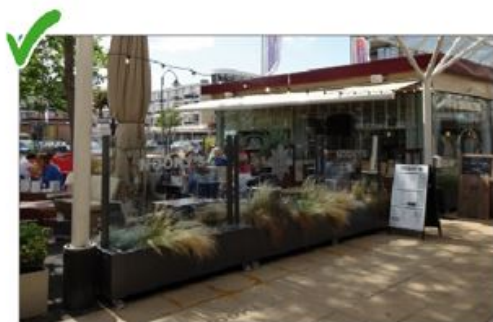
✓ Transparante terrasschermen dragen bij aan openheid