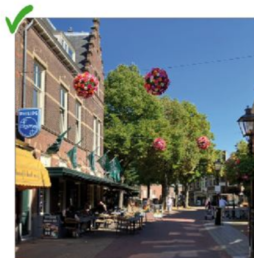
✓ Een terras met open uitstraling zorgt voor een mooi samenspel tussen gebouw, openbare ruimte en de terrasinrichting