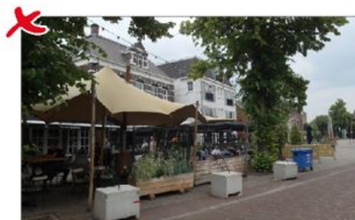
✗ Een gesloten terras met duidelijke afscherming draagt niet bij aan de uitstraling en beleefbaarheid van de openbare ruimte