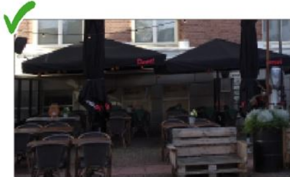
Een bescheiden hoeveelheid reclame op de volant van parasols