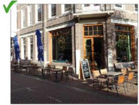
Passende materialisatie van terrasmeubilair zorgt voor een rustig straatbeeld