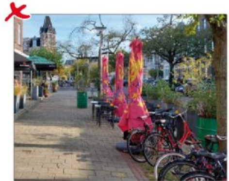
Parasols met felle kleuren en veel reclame sluiten niet aan bij historische uitstraling