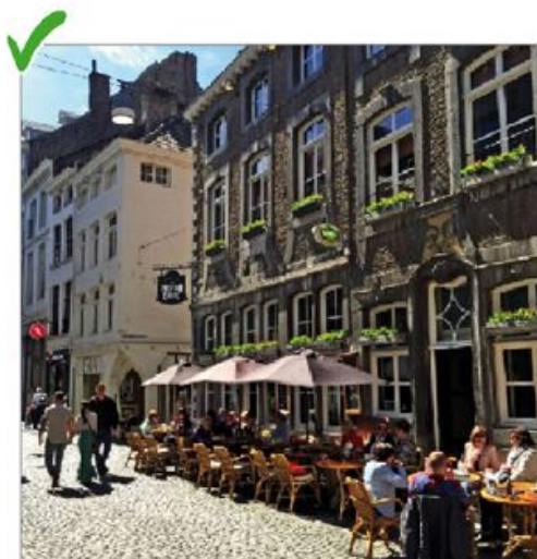
✓ Kleine parasols en losse tafels en stoelen zorgen voor openheid en waarborgen zicht op gebouw en straat