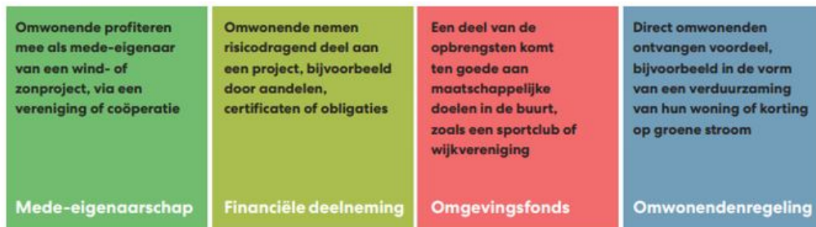
Figuur 1: Participatiewaaier

Juridisch (mede-)eigenaarschap is een vorm van actieve participatie. Hierbij zijn bewoners en/of ondernemers uit de lokale gemeenschap collectief betrokken als (mede-)eigenaar van zonnevelden of windmolens. Ze beslissen mee over het project. Bijvoorbeeld over de fysieke vormgeving van het project en de landschappelijke inpassing, de bestemming van winst, dividend en financiering.