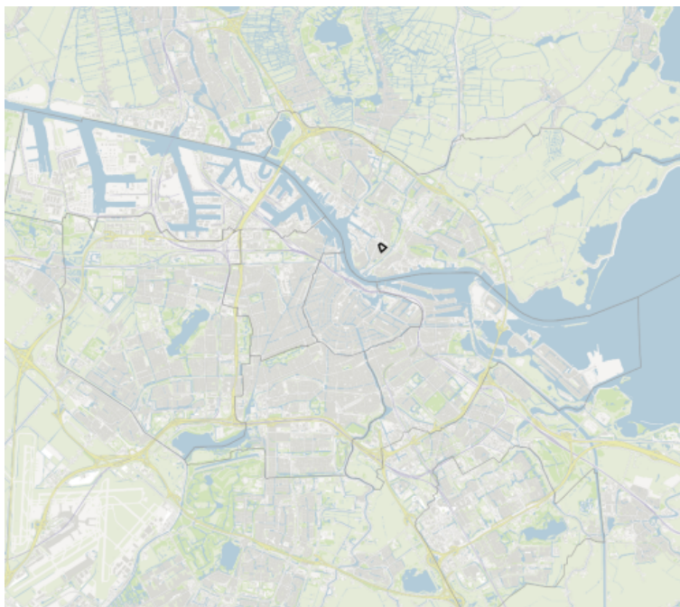
figuur 3e.1.1 - Overzichtskaart van Amsterdam met het gebied 'Gentiaanbuurt' gemarkeerd