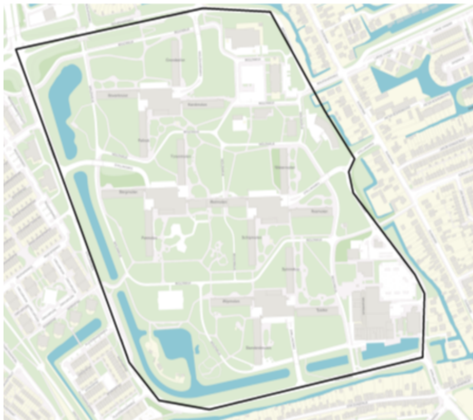
figuur 3d.1.2 - detailkaart met daarin het gebied 'Molenwijk' gemarkeerd

De volgende postcodes en bijbehorende huisnummers worden geacht binnen het gebied te liggen: