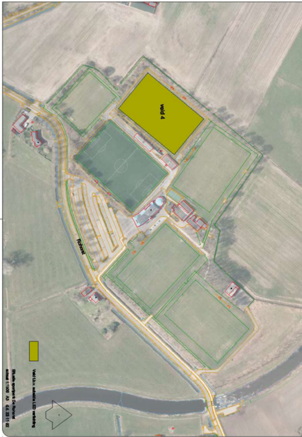
Sportpark De Bosrand, Vroomshoop