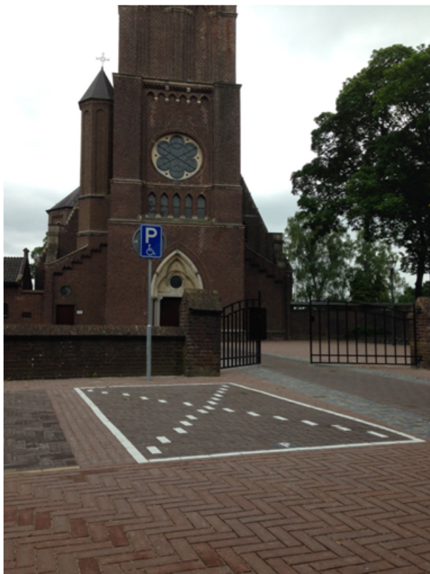
Algemene gehandicapten parkeerplaats bij Heilige Clemenskerk met bord E06 en kruis