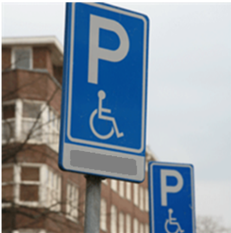
E6 met onderbord met kenteken

Een IGP moet voorzien worden van het bord E6 met onderbord en een witte kruismarkering op het wegdek.