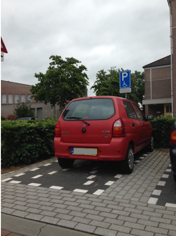
Individuele gehandicapten parkeerplaats met bord E6, kenteken en kruis