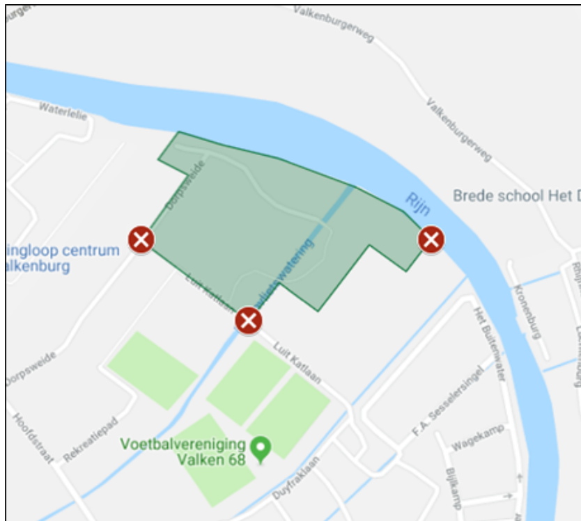
4. het Heerenschoolbos met dierenweide;