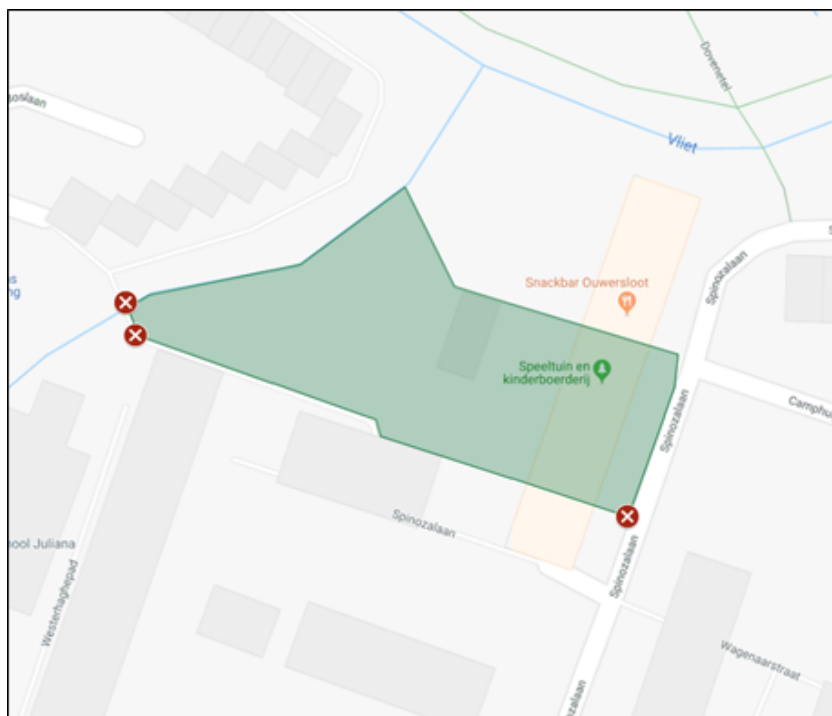
6. speeltuin De Valkenburcht met dierenverblijf.