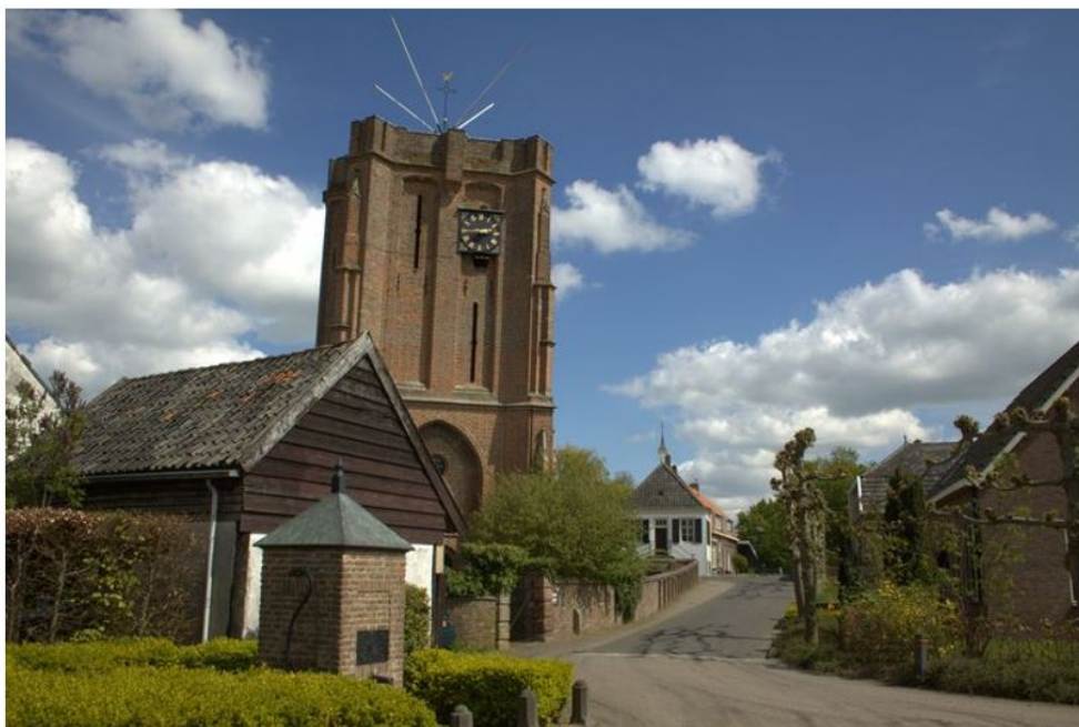
Figuur 2: Scheve toren van Acquoy, (gemeente West Betuwe, 2020)

In Bijlage 2 staat een overzicht van de kerktorens binnen de gemeente en de bijbehorende eigenaar. (Historische) torens zijn onderdeel van ons waardevolle erfgoed en daarmee belangrijk om te kijken hoe we ze kunnen behouden of in stand houden. Als gemeente gaan we verder onderzoek doen. Deze actie is opgenomen in het uitvoeringsprogramma onder uitgangspunt 1 (hoofdstuk 4 van de kerkenvisie). Vertrekpunt daarbij is dat de gemeente geen toren of torens in particulier bezit in eigendom overneemt. 1