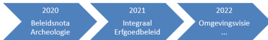
Figuur 1 Planning

Om relevante keuzes te kunnen maken die in lijn zijn met de andere beleidsdoelen die de gemeente zich stelt, zal straks een integrale afweging plaatsvinden. Dit betekent dat naast de inhoudelijke waarde van de archeologie, ook de andere waarden door de gemeente in ogenschouw worden genomen, in navolging van de Omgevingswet. Op deze wijze wordt het waarderingsproces van de archeologie maatschappelijk relevant.